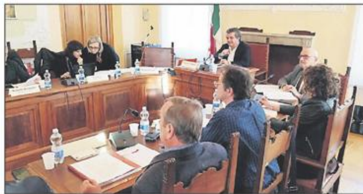
Sastanak je održan u talijanskom gradu Palmanovi

– Hrvatski restauratorski zavod izradio je konzervatorsko-tehnički elaborat obnove unutrašnjosti, a u 2018. ugovore-