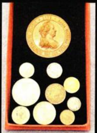
Novčići iz 1885.