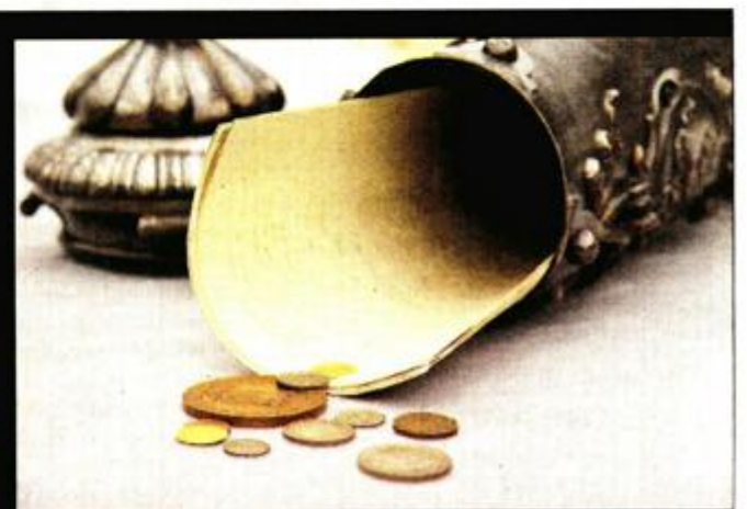
Sadržaj vremenske kapsule