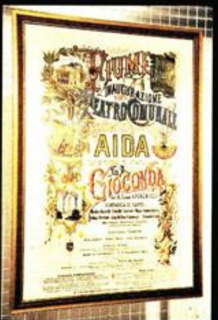
Unikatni plakat koji je najavljavao otvorenje kazališta