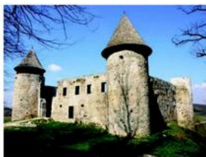
Pogled na Novigrad na Dobri danas

koje su u proteklih dvadeset i pet godina provedene pod vodstvom Konzervatorskog odjela u Karlovcu, uz identifikaciju povijesnih i graditeljskih vrijednosti svakog pojedinog grada, kao i potencijala međusobnog povezivanja na zajedničkoj platformi frankopanskoga kulturnog kruga, ratne prošlosti i povijesne granice naroda, kultura i religija.