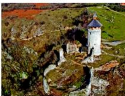
Stari grad Drežnik - tematski park