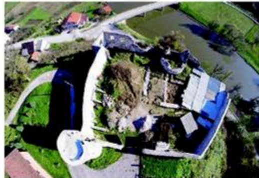
Detalj izgleda prostora pri arheološkim istražnim radovima