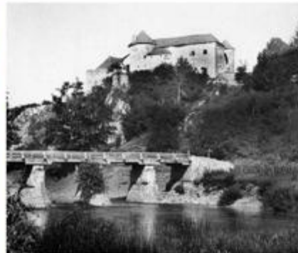
Pogled na Stari grad prije stradanja