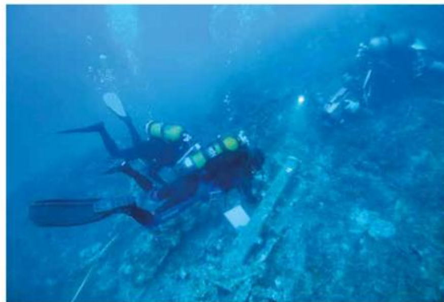
Podvodna arheologija: istraživanje brodoloma iz 16. st. u plicini Sv. Pavao pokraj Mljeta

Uredbom Vlade Republike Hrvatske iz 1996. o spajanju Zavoda za restauriranje umjetnina (ZZRU) i Restauratorskog zavoda Hrvatske (RZH) kao dvije javne ustanove konzervatorsko-restauratorskih djelatnosti u vlasništvu Republike