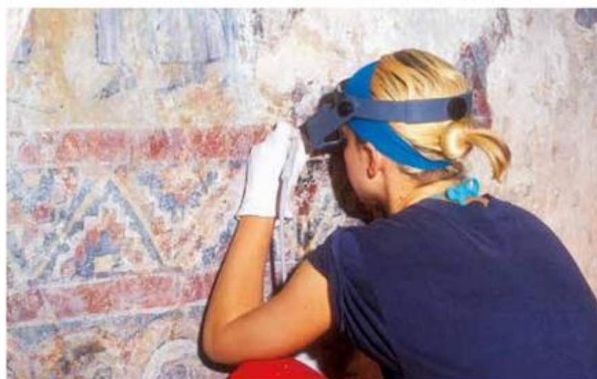
Zidno slikarstvo i mozaik: čišćenje zidne slike u zvoniku crkve sv. Marije u Zadru

U Muzeju za umjetnost i obrt u Zagrebu otvorit će se potkraj godine izložba kojom će se predstaviti ključni dionici i događaji vezani uz povijest restauriranja u 20. stoljeću u Hrvatskoj i kojom će Hrvatski restauratorski zavod obilježiti 70 godina kontinuirane konzervatorsko-restauratorske djelatnosti.