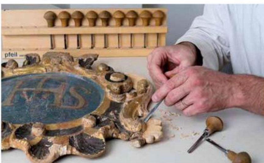
Drvena polikromna skulptura: rekonstrukcija rezbarije grba s oltara sv. Marije Magdalene iz kapele sv. Petra u Gotalovu