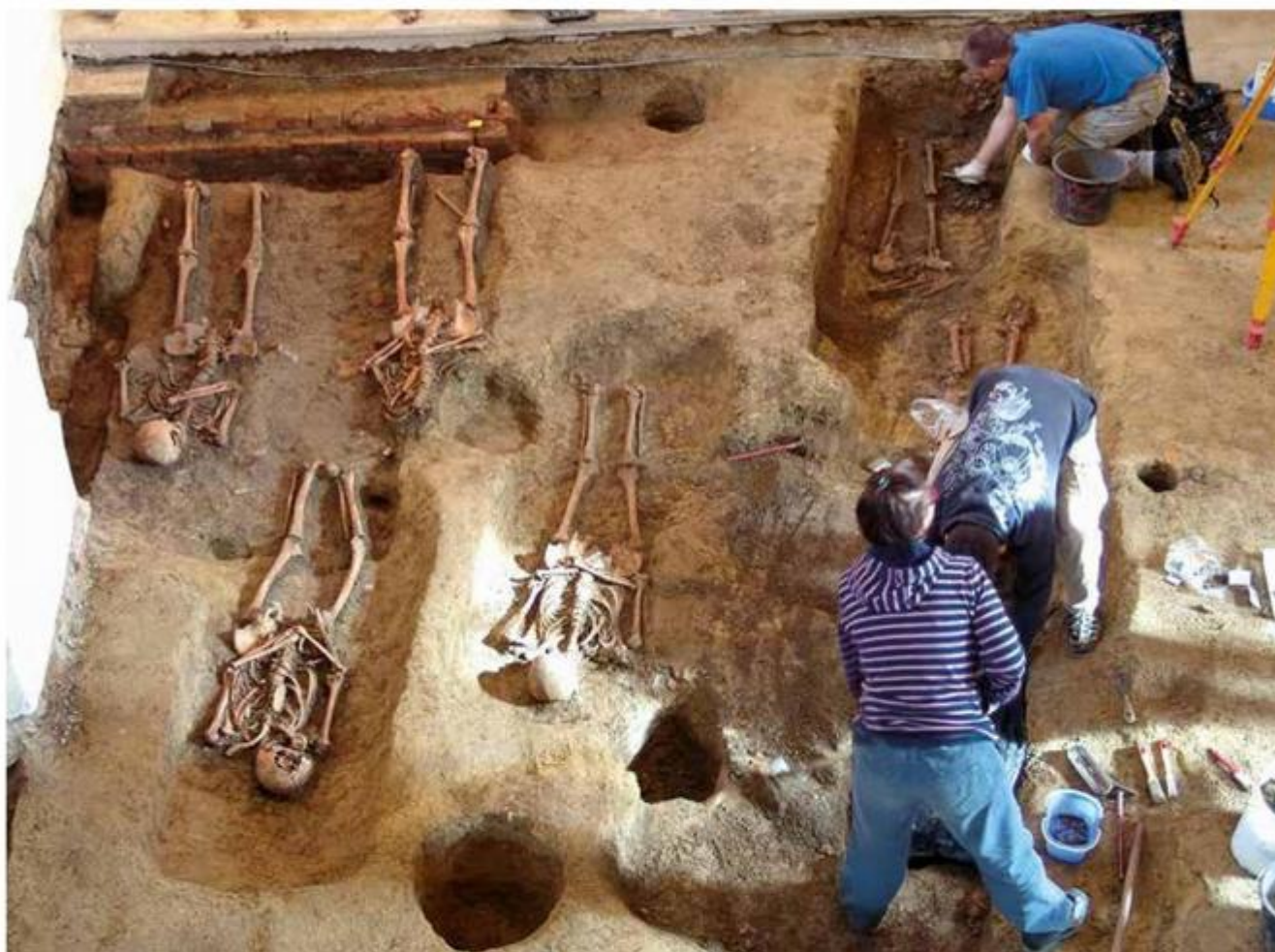
Kopnena arheologija: istraživanje novovjekovnog groblja u kapeli sv. Jeronima u Štrigovi

Hrvatski restauratorski zavod središnja je javna ustanova čija je osnovna djelatnost istraživanje, očuvanje i prezentiranje arheoloških, nepokretnih i pokretnih kulturnih dobara Republike Hrvatske. Osnovna djelatnost provodi se u suradnji s Upravom za zaštitu kulturne baštine Ministarstva kulture RH s ciljem očuvanja postojećih vrijednosti te stvaranja novih za buduće naraštaje.