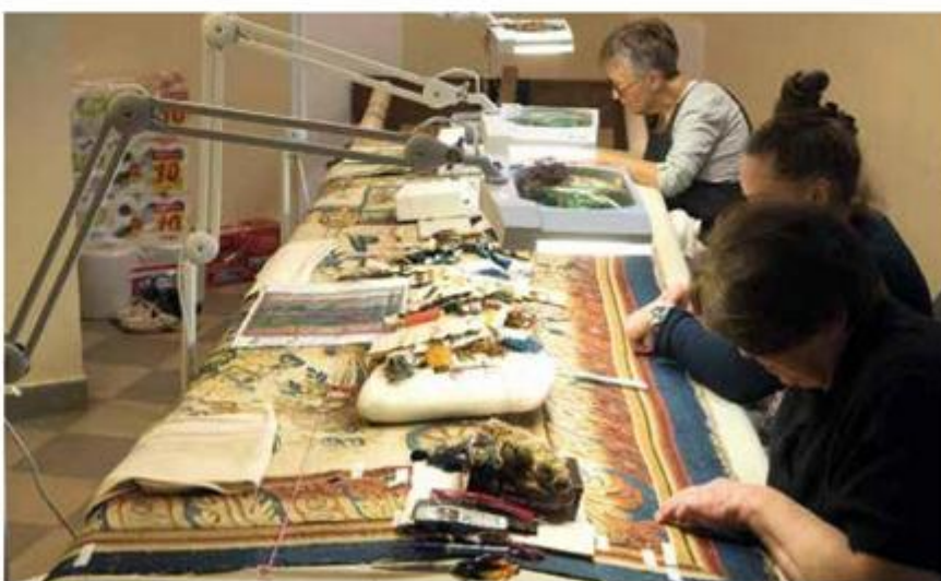
Tekstil: zatvaranje oštećenja na tapiseriji „Srpanj-kolovoz“ iz Zagrebačke nadbiskupije