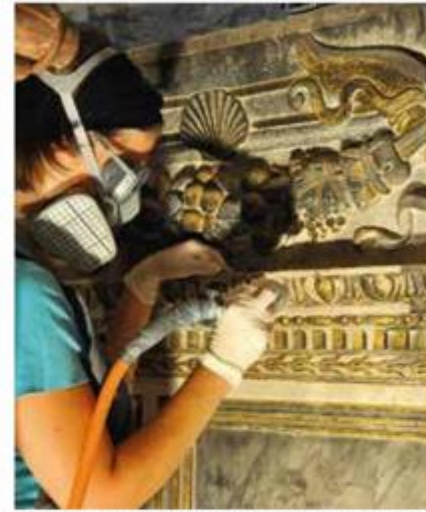
Kamena plastika: čišćenje kamena laserom tijekom obnove katedrale sv. Jakova u Šibeniku

U Dubrovniku je u prostoru Samostana male braće 1993. osnovana restauratorska radionica koja se istaknula doprinosom u spašavanju kulturnih dobara, posebice u razdoblju saniranja ratnih šteta na dubrovačkom području. Radionica je djelovala pri tadašnjem Zavodu za zaštitu spomenika kulture i prirode, a nabavljanje dijela opreme omogućila je svojom donacijom nadvojvotkinja Francesca von Habsburg. Znatno bolji uvjeti za rad restauratorskog odjela i proširenje njegove djelatnosti radionicom za papir ostvareni su 1999. obnovom ljetnikovca Stay sredstvima Ministarstva kulture i donacijom