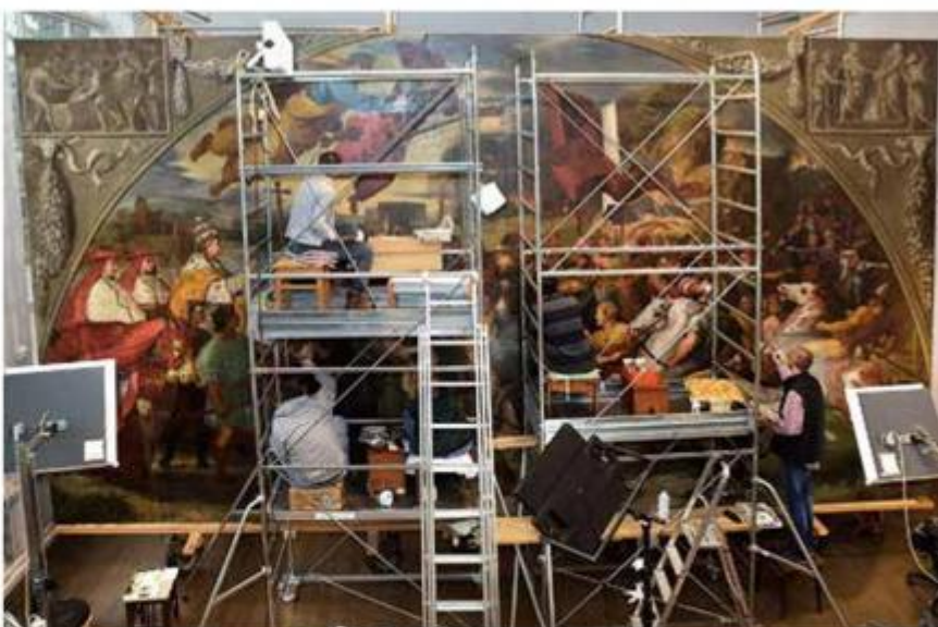
Štafelajno slikarstvo: retuš slike „Susret pape Lava I. Velikog s Atilom“ iz Strossmayerove galerije starih majstora u Zagrebu

Restauratorski zavod u Zagrebu je 1974. izdvojen iz Jugoslavenske akademije znanosti i umjetnosti, a od 1980. djeluje pod nazivom Zavod za restauriranje umjetnina. Godine 1988. osnovan je prvi odjel izvan Zagreba i to za istarsko-primorsku regiju, čime je započelo sustavno provođenje restauratorske djelatnosti na tom umjetninama bogatom području. Odjel s radionicama za polikromiranu skulpturu i štafelajno slikarstvo tada je smješten na dvije lokacije: u crkvi Marije Traverse u Vodnjanu te u prostorima nekadašnjeg župnog dvora i bivšeg samostana karme-