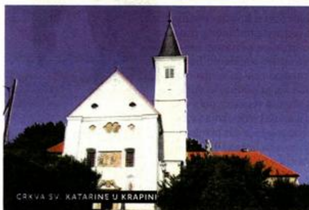
CRKVA SV. KATARINE U KRAPINI