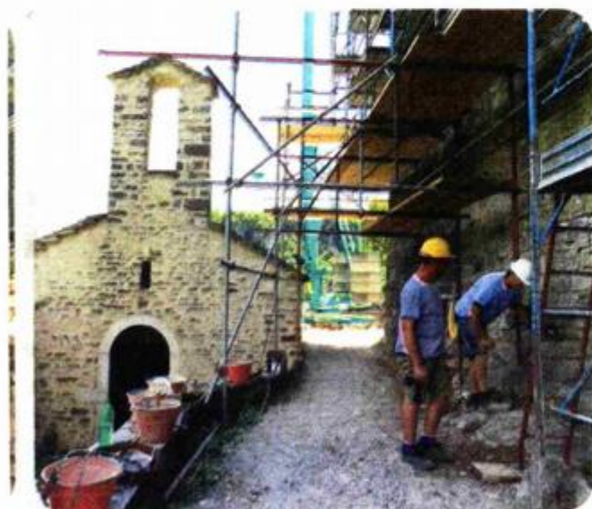
Građevinske radove izvodi Kapitel

Na sanaciji kaštela Petrapilosa, zaštićenog kulturnog dobra, radi se od 1995. godine. U fazama su odradene arheološka istraživanja i potpuna sanacija crkvice sv. Marije Magdalene, arheološka istraživanja unutrašnjeg dvorišta, građevinska sanacija središnjeg korpusa kaštela gdje su sanirani zidovi i spojevi palasa i kule, statički zahtjevni konstruktivni radovi. Do 2016. godine za radove i ulaganja na kaštelu te izradu prateće dokumentacije uloženo je sveukupno preko 4,7 milijuna kuna sufinanciranih sredstvima Ministarstva kulture, Istarske županije, Grada Buzeta te Regije Veneto.