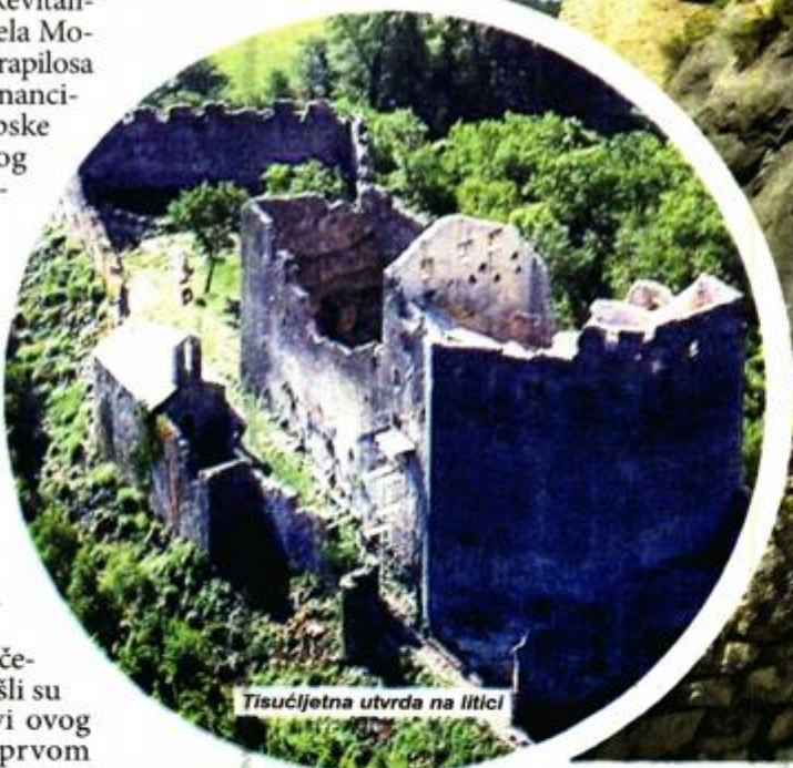
Tisućljetna utvrda na litici

Glavni cilj je revitalizacija kulturne baštine i integrirani razvoj. Ukupna vrijednost projekta je 22,59 milijuna kuna, EU sufinanciranje je 19,2 milijuna kuna. Na bužetski kaštel ukupno otpada 9 milijuna kuna