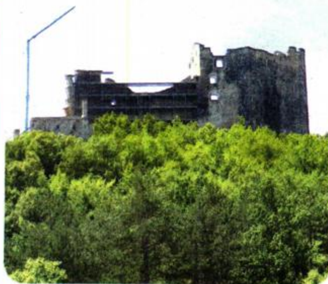
Sanacija postojećih zidina središnjeg dijela korpusa kaštela

Uz EU projekt KulTERRA gdje na Buzet ukupno otpada 9 milijuna kuna namijenjenih za rekonstrukciju, sanaciju i opremanje kaštela Petrapilosa, europskim sredstvima upravo se gradi sustav za prikupljanje i pročišćavanje otpadnih voda naselja Ročko Polje. Jedan je to od devet sustava iz programa Istarskog vodozaštitnog sustava sa sjedištem u Buzetu, koliko ih se sufinancira iz fonda za Ruralni razvoj u sklopu provedbe Mjere 07 "Temeljne usluge i obnova sela u ruralnim područjima" iz Programa ruralnog razvoja Republike Hrvatske za razdoblje 2014. - 2020., podmjere 7.2.1. Ulaganja u građenje javnih sustava za vodoopskrbu, odvodnju i pročišćavanje otpadnih voda. Prihvatljivi troškovi sufinanciranja su oko 5,57 milijuna kuna. U tijeku je izgradnja vodovodnog ogranka Perci - Črnica kojeg je Istarski vodovod Buzet također kandidirao na natječaj za provedbu Mjere 07 "Temeljne usluge i obnova sela u ruralnim područjima". Kompletna investicija financira se europskim sredstvima iz Programa ruralnog razvoja u iznosu od 2,7 milijuna kuna.