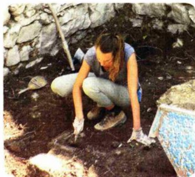
Arheološka istraživanja u vanjskom dvorištu