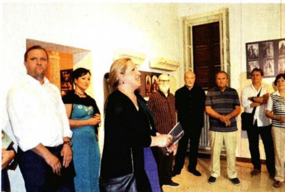
S otvorenja izložbe u SICU-u

Slike poliptiha pretrpjele su tijekom prošlosti velik stupanj mehaničkih oštećenja koja su se u pojedinim segmentima različito manifestirala na svakoj od njih. Na isti su način naknadne intervencije i restauratorski postupci mijenjali izvorna svojstva svih konstruktivnih dijelova slika. Takvo stanje je zahtijevalo individualan pristup svakoj slici poliptiha te prilagodbu zahvata pojedinačnom zatečenom stanju kako bi se naposljetku dobili ujednačeni rezultati nena-metljive intervencije.