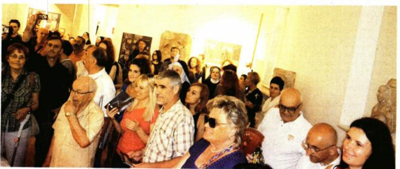
Nazočnost brojnih Zadrana ukazala kako se radi o doista velikom kulturnom događaju