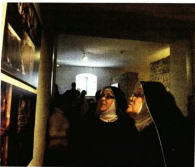
Časne fascinirane izloženim radovima