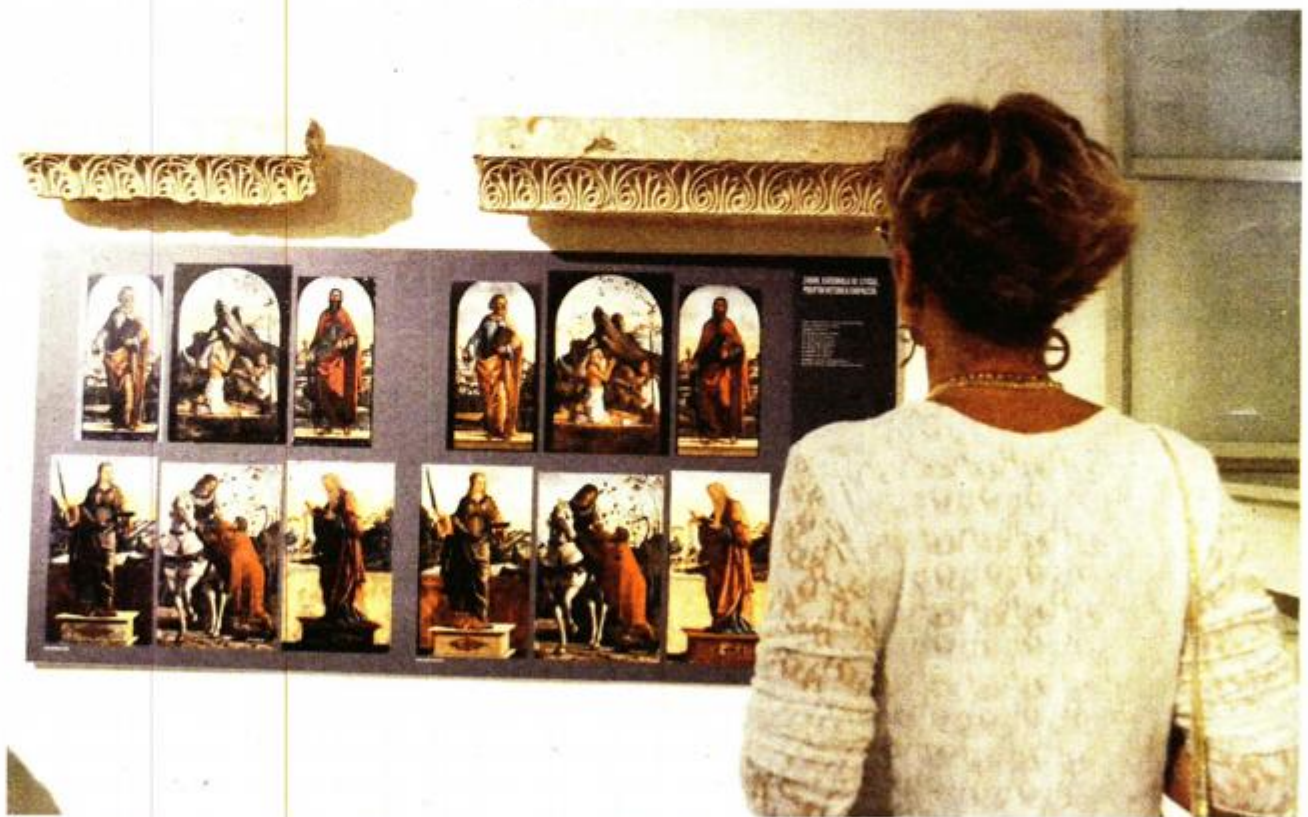
Izložba otkrila vrhunac rada restauratorske radionice u Zadru

– Recentnim, sveobuhvatnim konzervatorsko-restauratorskim radovima provedenim u Hrvatskom restauratorskom zavodu na