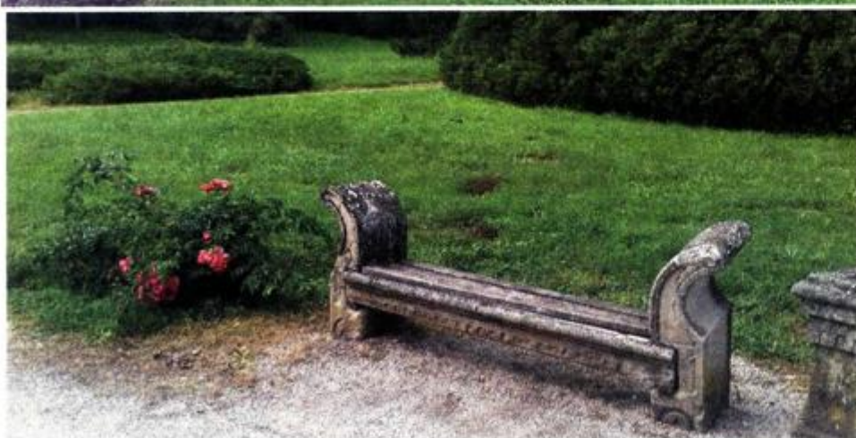
Izvorne klupe od kamena iz 19. stoljeća

dio idejne skice obnove, međutim do nje nije došlo. Osamdesetih je godina planirano novo uređenje, ovoga puta za potrebe ustanove Arboretum Opeka iz Vinice. Bio je osiguran dio sredstava kojim su započeti radovi, ali se