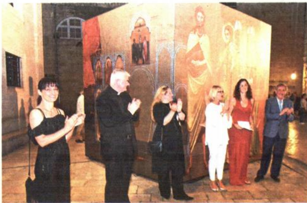
Predstavljanje rezultata projekta 'Nepoznata trečentistička slikarska radionica - deatribucija Matka Junčića i Ivana Ugrinovića' i izložbene instalacije 'Skriveni trečento' ispred Kneževa dvora

Tako zamišljena izložbena instalacija umjetnički je i provokativni iskorak u odnosu na uobičajena predstavljanja konzervatorsko-restauratorskih radova, izlazak iz prostora radionica i muzeja