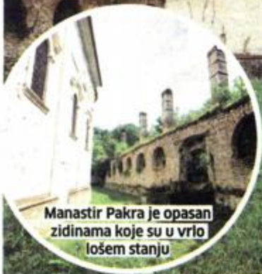
Manastir Pakra je opasan zidinama koje su u vrlo lošem stanju