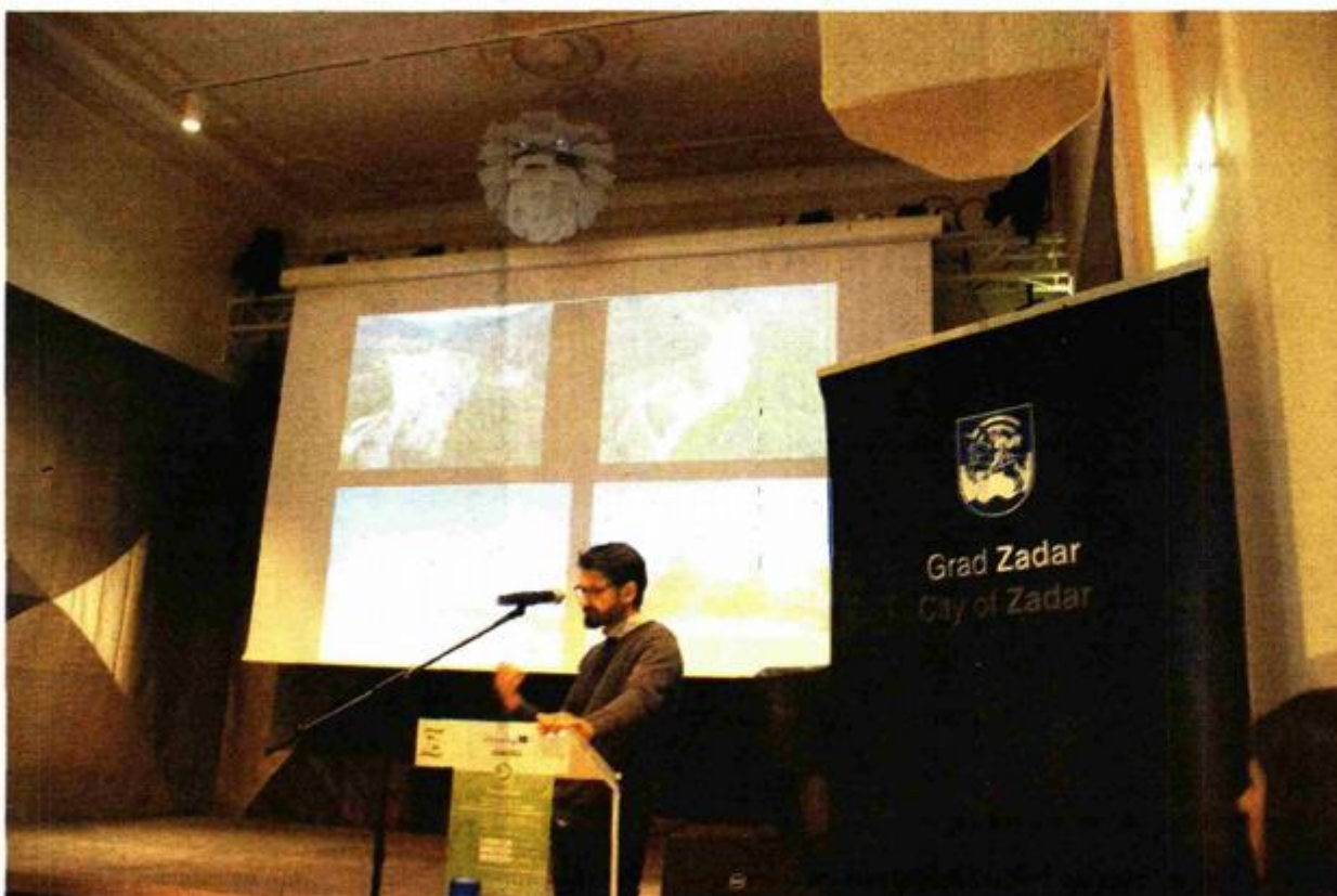
Seminar u Kneževoj palači

ZADAR - U iznimno bogatoj arheološkoj baštini grada Zadra i Zadarske županije prošloga su tjedna imali prilike uživati arheolozi iz osam europskih zemalja koji zajednički provode međunarodni projekt u okviru programa "Interreg Central Europe 2014-2020" - pod nazivom "Visualize to Valorize - For a better utilisation of hidden archaeological heritage in Central Europe" - akronima "VirtualArch".