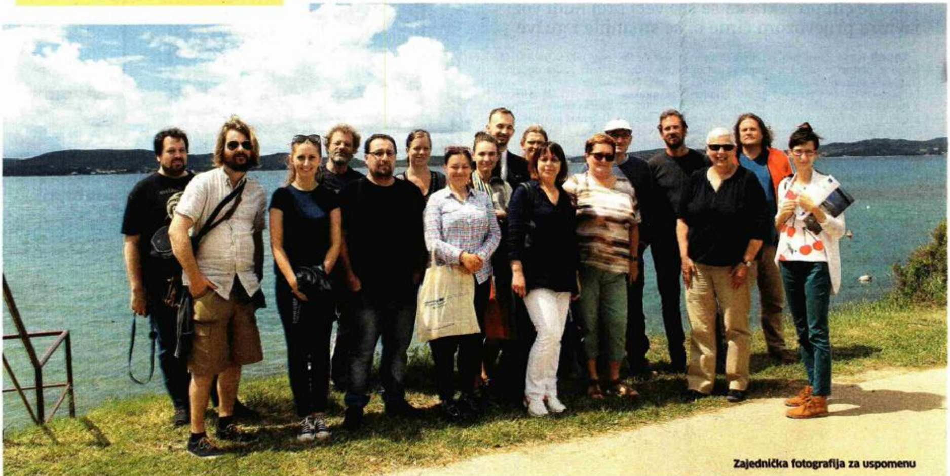
Zajednička fotografija za uspomenu

Zajednički cilj svih partnera na ovom projektu bio je doprinos od nevidljivih ili manje znanih arheoloških, podzemnih i podvodnih projektni partneri koristili inovativne vizualne pristupe i metode sve s ciljem zaštite arheoloških nalazišta i njihovog otkrivanja za