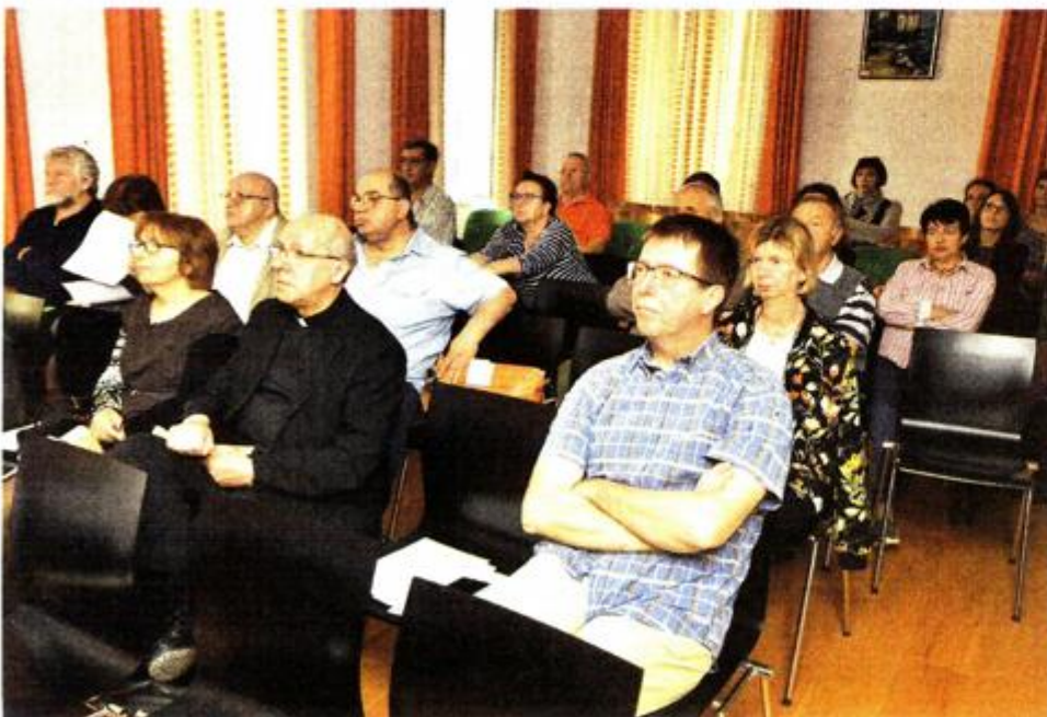
Creski anali privukli velik broj otočana