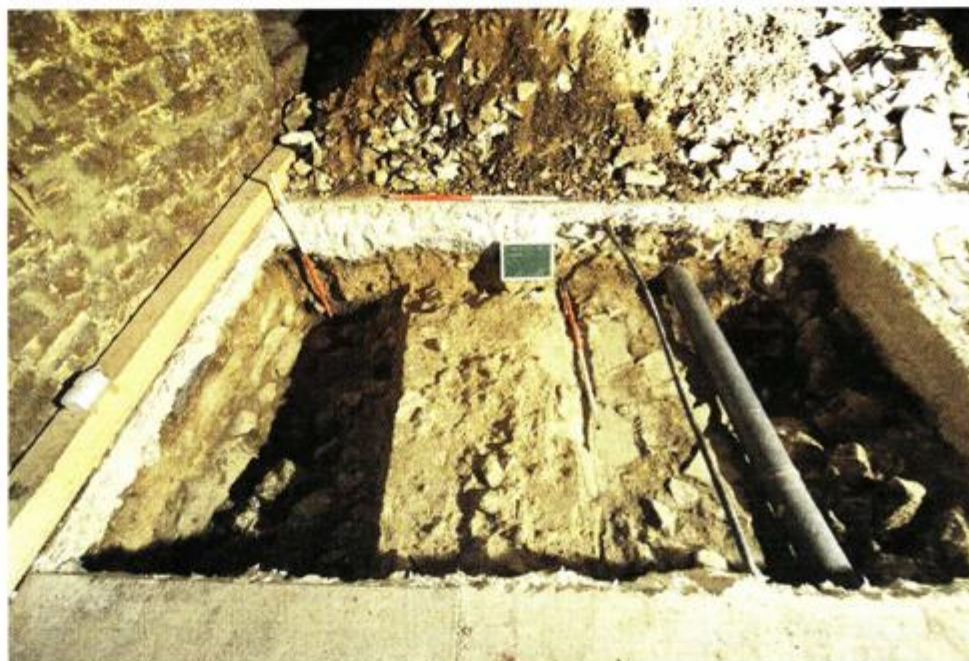
Srednjovjekovni zid starijeg pazinskog kaštela

ratu 1508.-1516. kaštel je pretrpio znatna oštećenja, pa Austrijska državna komisija 19. lipnja 1534. izvješćuje o ruševnom stanju utvrde, predloživši da se na mjestu