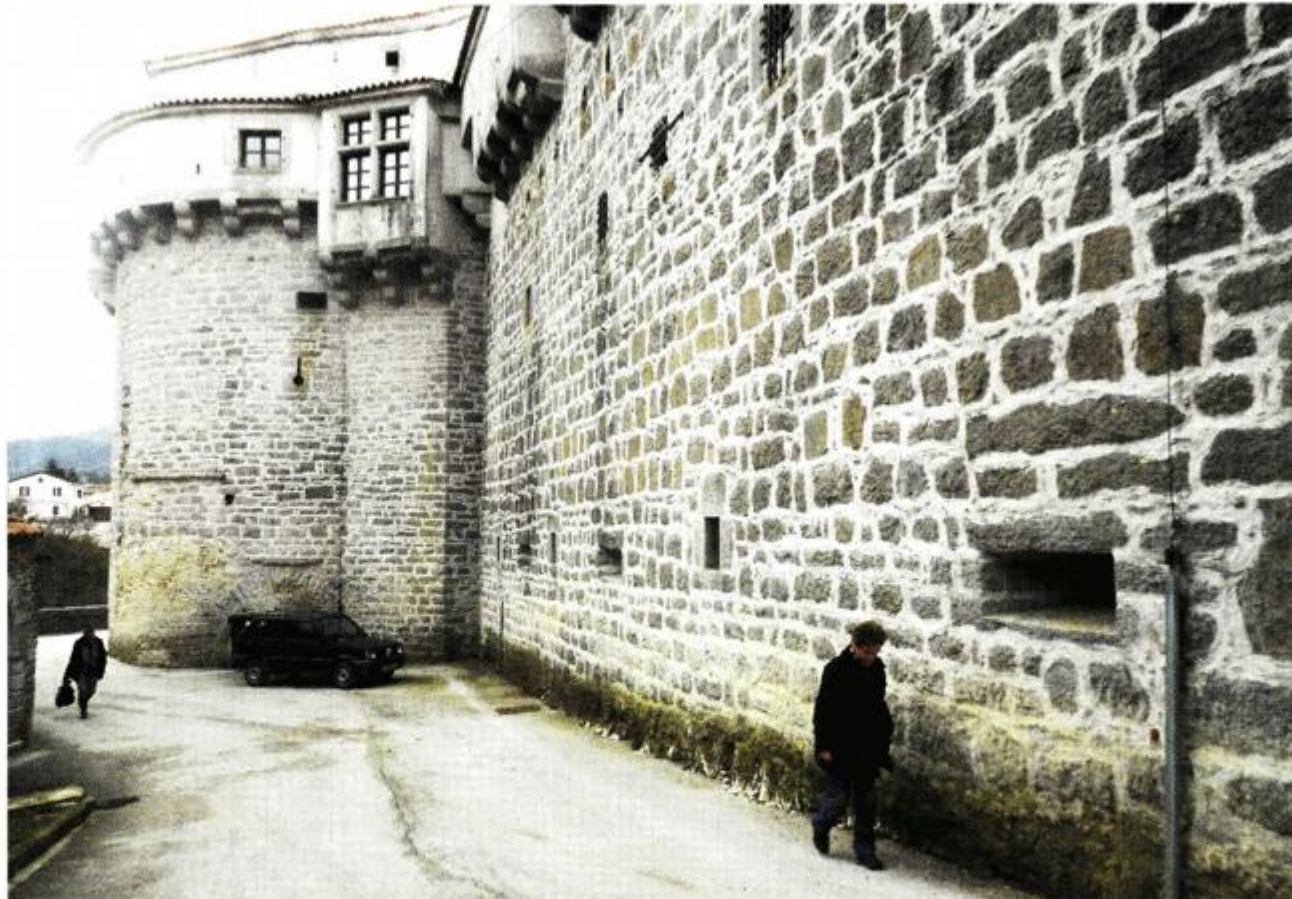
Sjeverni bedem pazinskog kaštela unutar kojeg je otkriven raniji srednjovjekovni obodni zid

Najvjerojatnije se radi o zidu kaštela kojeg su izgradili ili obnovili grofovi Gorički, koji su Pazinskom grofovijom vladali od 1191. ili 1194. do 1374. godine, kada Pazin prelazi u ruke Habsburgovaca