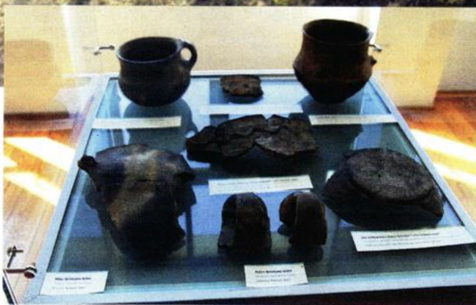
Sutra se otvara izložba u Augustovom hramu