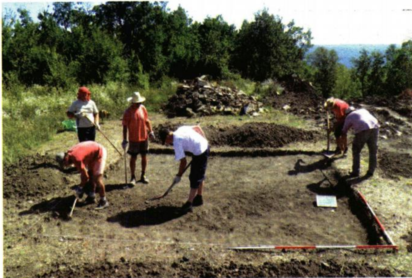
Bogatstvo na svega 58 kvadrata

S arheološkog gledišta, najvažniji je taj kontinuitet od neolitika preko brončanog i željeznog doba do antike i srednjeg vijeka, ističe voditelj arheoloških istraživanja Tihomir Percan • Najstariji tragovi sežu u razdoblje neolitika (od 7. do 3. tisućljeća prije Krista), poput male kremene strelice ili nedovršene sjekire, a tu su i ostaci tegula i amfora iz antičkog vremena