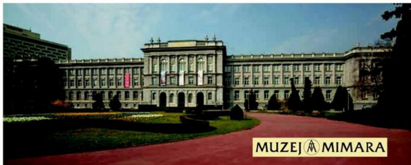
Muzej Mimara

Poriv i želju da svoju raskošnu zbirku podari Hrvatskoj ostvaruje već 1948., donacijom Strossmayerovoj galeriji HAZU-a u Zagrebu. Donacija je prezentirana na izložbi održanoj 1969. Skupljačkim zanosom nastavlja povećavati zbirku, pretvarajući je u istinski dragulj u kojem se prelijevaju raznorodna ostvarenja nastala tijekom tisućljeća. Kao odličan poznavatelj umjetnosti i zaljubljenik u umjetnička djela i dalje neumorno istražuje i sudjeluje