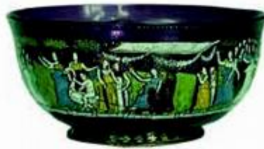
Zdjelica, Murano oko 1450. staklo; raznobojni emalj; pozlata; srebro vis. 6,3 cm; promjer podnožja 8 cm; promjer otvora 13,5 cm; inv. br. ATM 1783