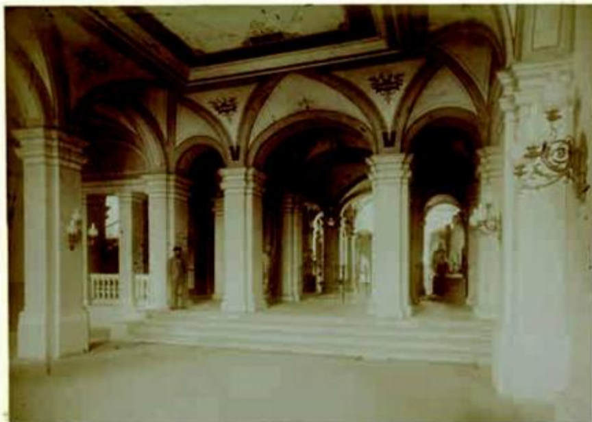
Fotografija predvorja škole s Muzejom gipsanih odljeva u pozadini nastala oko 1900.