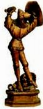
Jacques de Baerze, djeluje u Burgundiji krajem XIV. St. Sv. Juraj orahovina; vis. 53 cm; šir. 21 cm; inv. br. ATM 1260

U realizaciji iznimno bogatog programa Muzeja sudjeluju kustosi, restauratori, djelatnici odjela marketinga i odnosa s javnošću, pedagoške radionice, tehnička ekipa Muzeja, informatički djelatnici, zaposlenici odjela dokumentacije, djelatnici svih ostalih službi. Uz stalni postav koji se prezen-