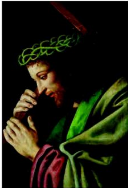
Vincenzo di Biagio Catena, Krist nosi križ , 1525. ulje na drvu; vis. 48 cm; šir. 34,5 cm; inv.br. ATM 1956, str. 61 i 62

nacijama, predstavljena je 4. veljače 1993. Muzej Mimara brojnim popratnim izložbama, izložbama u sklopu ciklusa Oči istine te izložbama u suradnji s Restauratorskim zavodom Hrvatske šalje sliku o ratnoj tragediji uništavanja života, sudbina, kulturne baštine, životnih prostora i objekata. U Muzeju se održavaju brojne humanitarne akcije, izložbe i koncerti s porukama suosjećanja i istinske želje za pružanjem utjehe i pomoći. Poštujući temeljni koncept stalnog postava, kustosi od 1996. postupno prezentiraju obrađena djela, čineći fondus uvijek iznova izvorom stručnih spoznaja. Popratne izložbe, katalozi, deplijani, najširoj javnosti jasno objašnjena djela u tematskim tv-emisijama čine Muzej uvijek prisutnim tkivom kulture Zagreba i Hrvatske. U svim proteklom godinama nastavljen je suradnja s prof. dr. Wiltrud Mersmann Topić koja povremeno posjećuje Muzej i uz godišnjicu donatorove smrti ugošćuje djelatnike Muzeja u svom domu u Salzburgu.