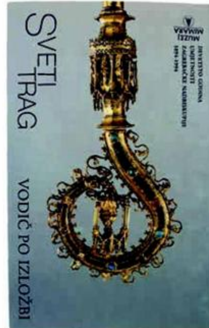
Izložba Sveti trag , 2004.

tira novim vodičem, pojedini se segmenti građe obrađuju u znanstvenim studijama (napisane su 44) i katalozima zbirki. Nastavlja se prezentacija fundusa putem popratnih izložbi, u Muzeju se postavljaju izložbe suvremenih umjetnika, izložba Sveti trag