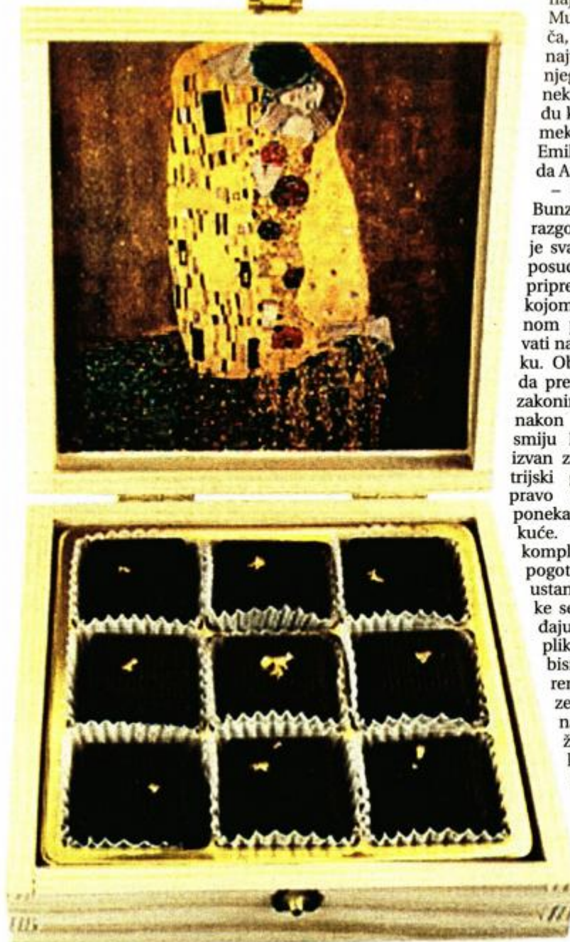
Neki ovako doživljavaju izložbu u MGR-u

- Pitao sam se što Rijeka kao Europska prijestolnica kulture uopće može novoga