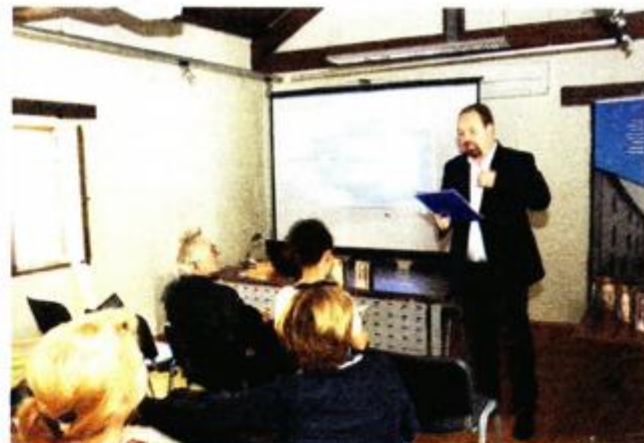
U Vodnjanu su, u sklopu projekta, održane i stručne radionice

Upravo su financije, koje restauratori i konzervatori dobivaju iz državnog budžeta, najčešći problem kod obnove, i nije nepoznanica koliko je problem doći do neophodnih financijskih sredstava koja ponekad stignu doslovno u "pet do 12", a ponekad naša sakralna baština, nažalost, ne dočeka taj spas i zauvijek propadne.