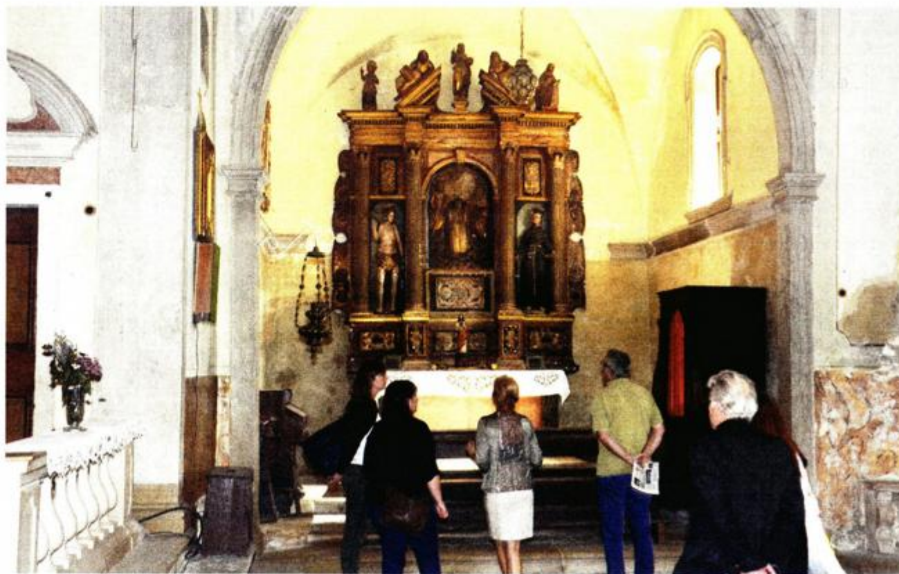
Crkva Gospe Karmelske u Vodnjanu sagrađena je 1630. godine

U Vodnjanu su, u sklopu projekta, održane i stručne radionice