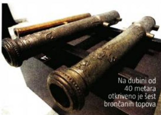
Na dubini od 40 metara otkriveno je šest brončanih topova