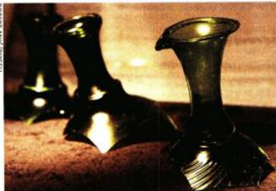
Nalazi su potvrdili pretpostavku da je orijentalni trgovački teret bio namijenjen zapadnom tržištu