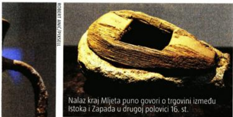
Nalaz kraj Mljeta puno govori o trgovini između Istoka i Zapada u drugoj polovici 16. st.