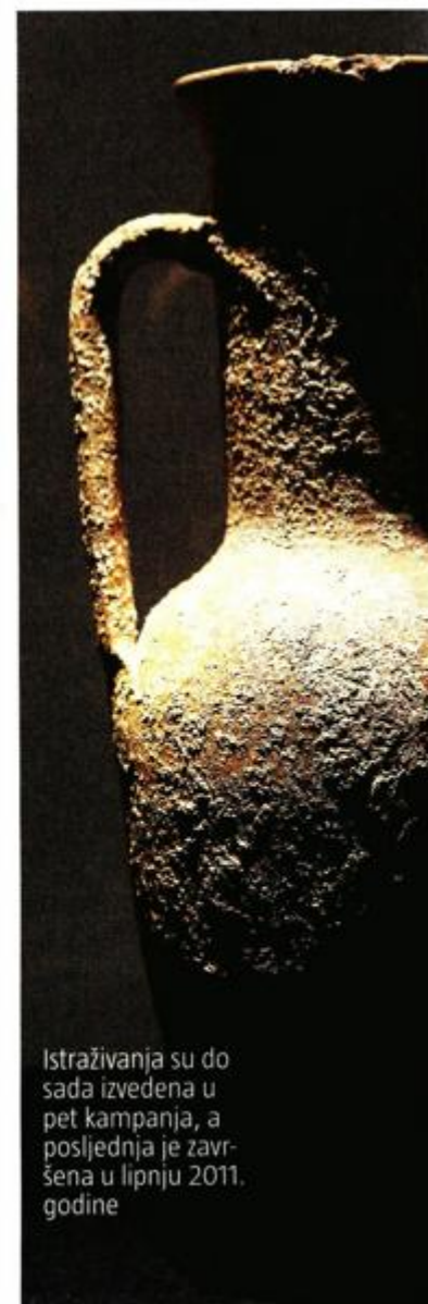
Istraživanja su do sada izvedena u pet kampanja, a posljednja je završena u lipnju 2011. godine