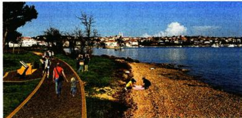
Šetači će moći koračati stazama kojima su nekad hodali rimski carevi

Bit će to potpuno nov sadržaj za mještane, ali i njihove goste, što će, nadaju se, dodatno ojačati te produljiti turističku sezonu