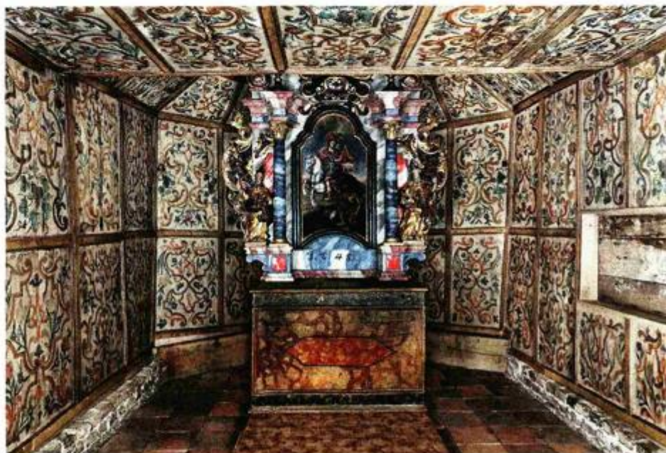
Interijer kapele sv. Martina u Starom Brodu

Kapela sv. Martina u pokupskom selu Stari Brod, u okolici Siska, izvanredan je primjer tradicijske hrvatske arhitekture i jedna je od četrdesetak očuvanih sakralnih drvenih građevina na tom području, koje datiraju između 17. i 19. stoljeća. Mala kapela vjerojatno je sagrađena u ranom 17. sto-