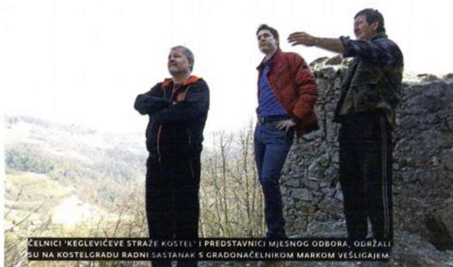
ČELNICI 'KEGLEVIĆEVE STRAŽE KOSTEL' I PREDSTAVNICI MJESNOG ODBORA, ODRŽALI SU NA KOSTELGRADU RADNI SASTANAK S GRADONAČELNIKOM MARKOM VEŠLIGAJEM

riranog kostelgradskog zida bit će održano samo otvorenje manifestacije, dok će se svi događaji te održavati na drugim, primjerenijim lokacijama. Središnji događaj bit će na Veliku subotu na asfaltiranom igralištu Područne škole 'Kostel', no Flegar kaže kako se nada da će narednih godina sam Kostelgrad biti dovoljno uređen da se u njega preseli kompletna manifestacija.