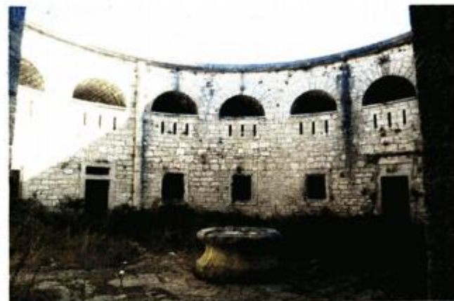
Pokušava se zaštititi kulturno dobro

Nadalje, pojašnjava se u presudi, da se radilo o objektu kojim je upravljala i raspolagala JNA proizlazi i iz toga što sama tvrđava Sveti Juraj nije ucrтана u katastru, već je ista ucrтана ručno od strane mjerneičnog vještaka za potrebe vještačenja u ovom predmetu, a koji je naveo da se vojni objekti nisu ucrtavali u katastarske planove. Temeljem toga, sud je zaključio "da se u konkretnom slučaju radilo o objektu koji je bio pod civilnom upravom bivše Općine Pula kao nositeljem prava upravljanja i raspolaganja, a samo u posjedu JNA, tada bi zasigurno bio ucrтан u katastru kao što je to slučaj s drugim objektima na kojima su civilne vlasti imale pravo upravljanja i raspolaganja. Opće je poznato da su vojni objekti bili, kao što su i danas, pod posebnim režimom. Radi toga nije neobično