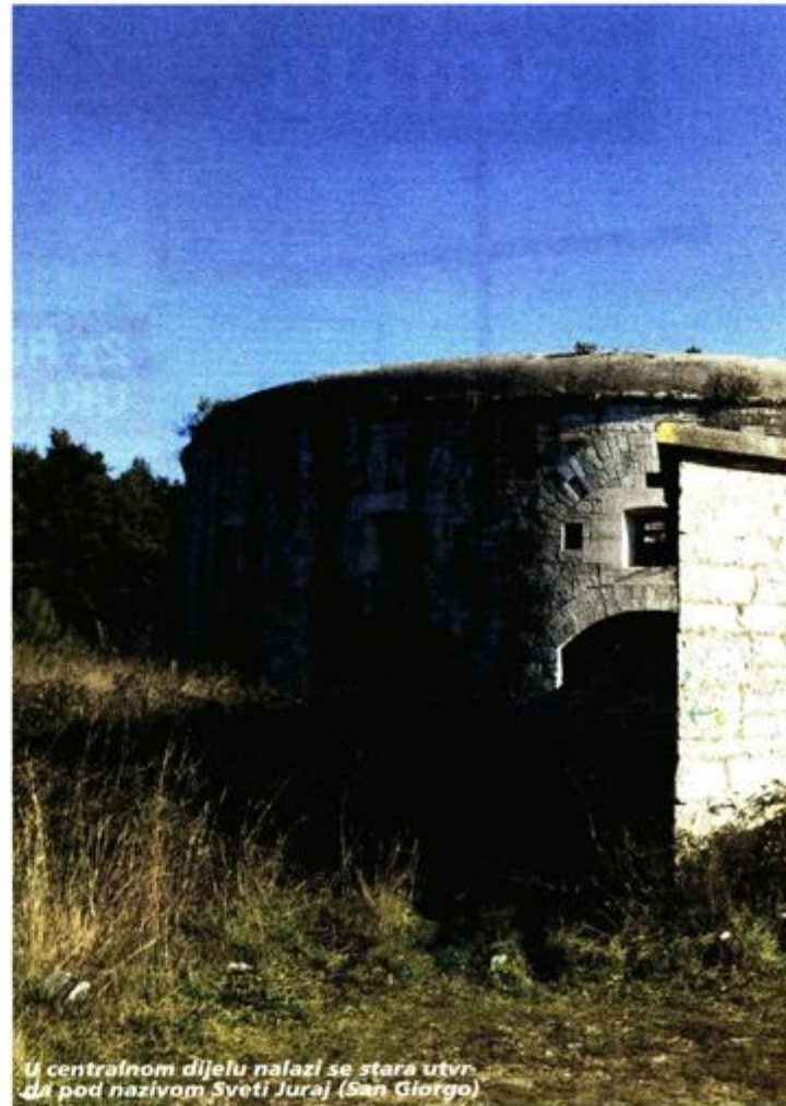
U centralnom dijelu nalazi se stara utvrda pod nazivom Sveti Juraj (San Giorgio)

Po stavu ovog suda tužitelj, RH, dokazao je da je JNA imala pravo upravljanja i raspolaganja na tim nekretninama, a ne samo pravo posjeda. Do navedenog zaključka sud je došao na temelju toga što je JNA u svojim dokumentacijama taj kompleks vodila kao svoju imovinu što prvenstveno proizlazi iz izvoda iz popisa 657. Mornaričke pozadinske baze. U tom izvodu se kao nositelj imovinskog prava navodi SSNO u površini od 28.403 četvorna metra.