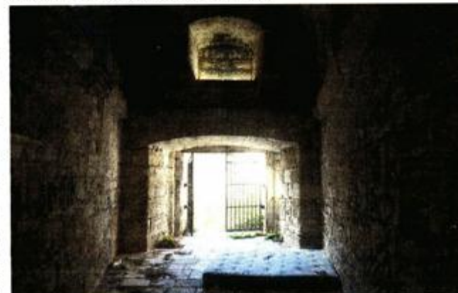
Trenutno je objekt napušten