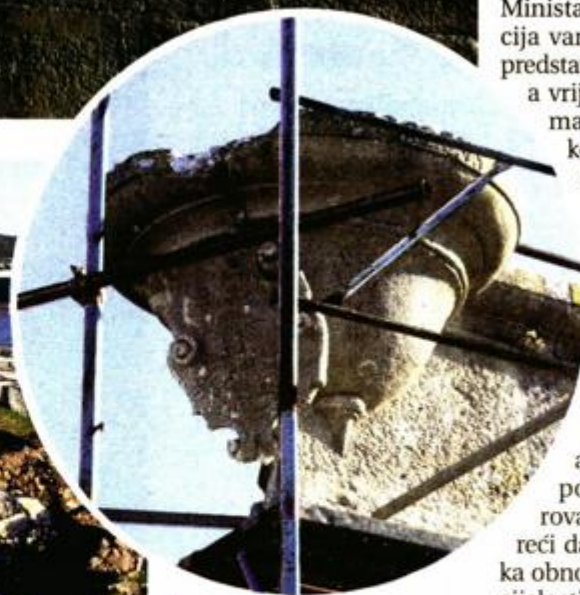
Čisti se i popravlja kameni rubni vijenac

- Za to je potrebno prvo izraditi projekt, koji mora potvrditi Konzervatorski odjel Ministarstva kulture. Sanacija vanjskog plašta zidina predstavljat će veliki zahvat, a vrijednost radova, prema provizornom troškovniku, koji su izradili stručnjaci Hrvatskog restauratorskog zavoda, biti će oko pet milijuna kuna. Kada bude dovršen projekt, sredstva ćemo pokušati privući iz međunarodnih fondova. Tek kada taj projekt realiziramo i saniramo potporne zidove oko rova utvrde moći ćemo reći da smo blizu dovršetka obnove i zaštite Kaštela u cijelosti, zaključio je ravnatelj Kešac.