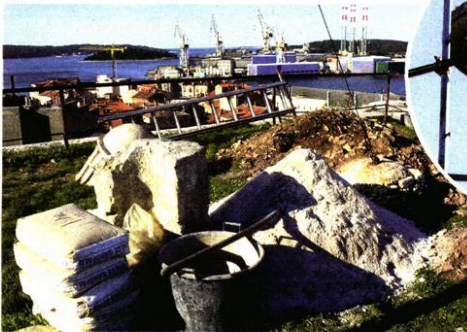
Radove izvode djelatnici žminjskog Kapitela

Radovi su počeli sredinom studenoga, a trajati će do kraja godine. Inače, vrijednost cjelokupnog projekta sanacije sjeverne kortine Kaštela je gotovo 1,2 milijuna kuna, a po dovršetku radova koji su u tijeku preostat će još 330 tisuća kuna za dovršetak radova.