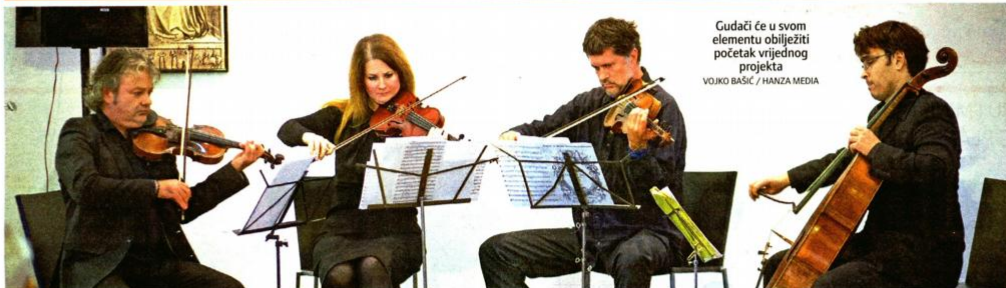
Gudači će u svom elementu obilježiti početak vrijednog projekta

ALELUJA! KONAČNO ZAPOČINJE REKONSTRUKCIJA I ADAPTACIJA ZGRADE HRVATSKOG DOMA U TONČIČEVOJ ULICI