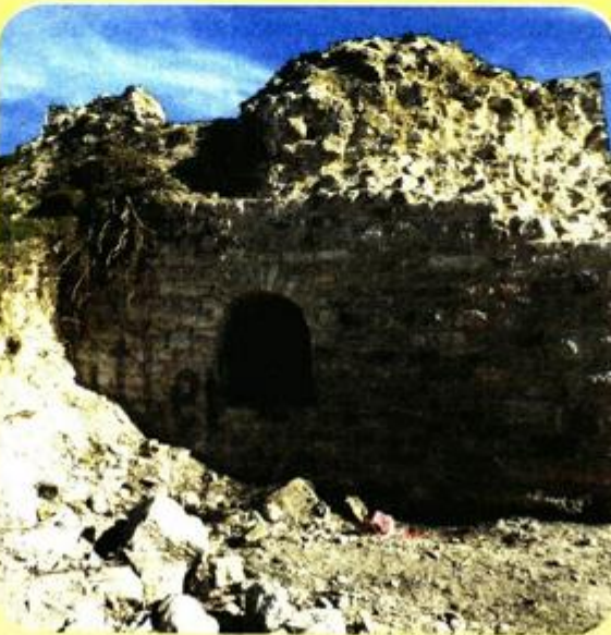
I danas se lijepo vide ostaci crvene boje, kao i neka od slova prezimena Hitler

Kula je dodatno uništena tijekom Drugog svjetskog rata, kada je povremeno bila korištena kao osmatračnica. Te 1944. godine partizani su na zidovima kule nacrtali veliku zvijezdu petokraku koja se mogla vidjeti i u Rovinju, a koju su nedugo potom njemački vojnici prekrili velikim kukastim križem. Nakon što su partizani po drugi puta nacrtali zvijezdu, kula je djelomično srušena dinamitom od strane Nijemaca. Tom su prilikom srušeni gotovo svi vanjski zidovi kule, a njezini ostaci zatrpani urušenim građevinskim materijalom. Potvrde o istinitosti ovog događaja pronađene su prilikom provedenih istraživanja kada su detektirane dvije pozicije, na sjeveroistočnom i jugozapadnom kutu kule, na kojima je dinamit bio postavljen, a 2015. godine i kada je, kaže Višnjić, pronađeno i petnaest kilograma neeksplozivnog eksploziva.