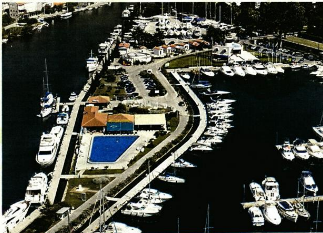
ACI marina Dubrovnik i ove je godine zabilježila odlične rezultate

Vijest od prije par dana prvi je nagovještaj velike promjene. Ministarstvo regionalnog razvoja i fondova Europske unije odobrilo je