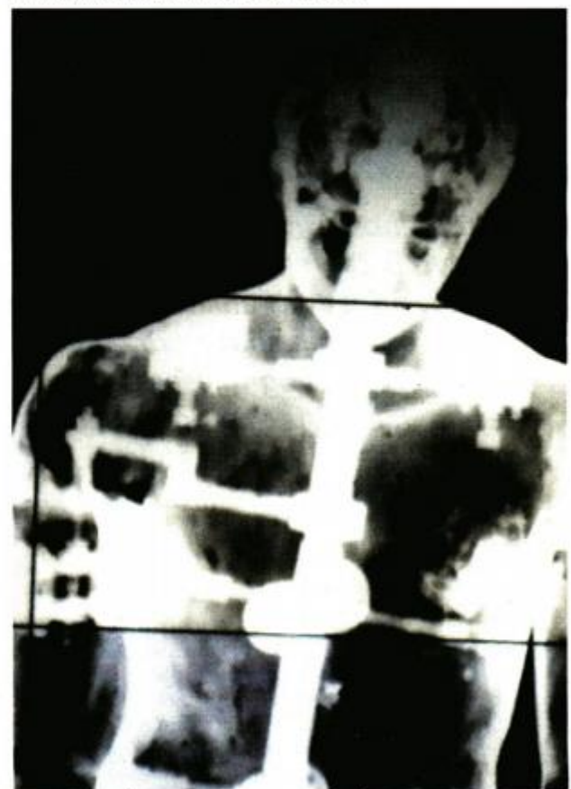
Metalni kostur koji je izradio Antonio Šerbetić iz Hrvatskog restauratorskog zavoda