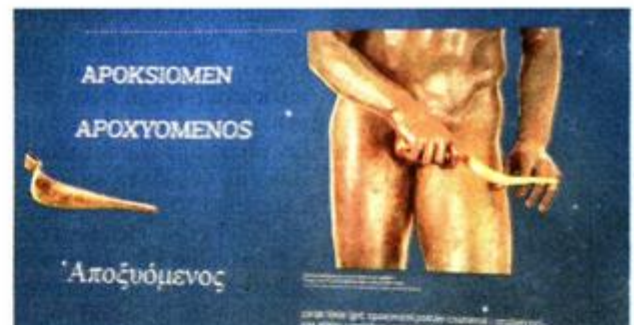
Rekonstrukcija strugaljke kojom je atleta čistio znoj, prašinu i ulje sa tijela

Apoksiomen predstavlja mladog atletu u dobi od oko dvadeset godina, koji sa sebe čisti znoj, prašinu i mirisno ulje kojim su, prije vježbanja, premazivana tijela sportaša za zagrijavanje mišića, kao zaštita od sunca i prašine te da bi se sačuvala vlažnost kože. Struganje naslaga sa tijela, grčki apoxye-sis, se vršilo posebnom strugaljkom, a mladi atleta je prikazan baš u trenutku čišćenja svoje strugaljke, dakle on je apoxyomenos. Smjesa skupocjenog ulja, prašine ili pijeska se nije bacala već se sakupljala, filtrirala i prodavala, što je bio prihod za tadašnje palestere u kojima su sportaši vježbali.