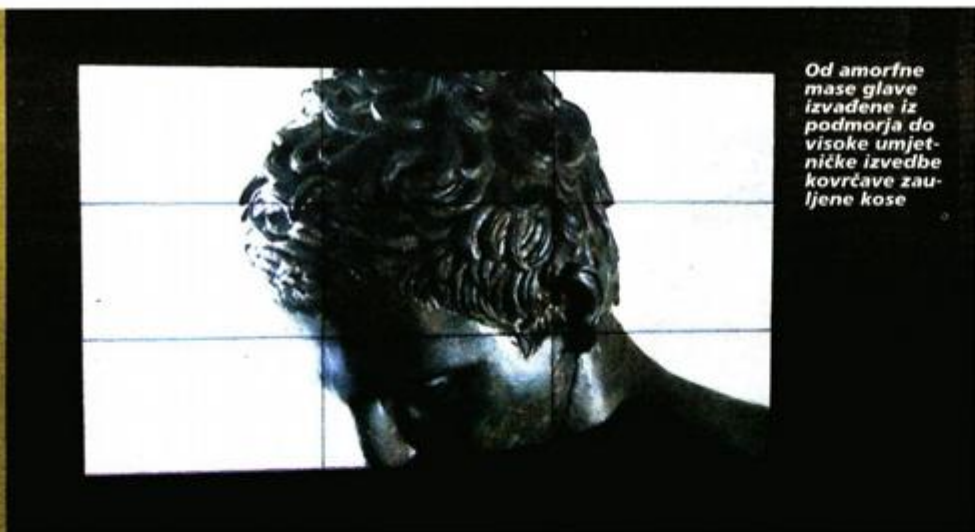
Od amorfne mase glave izvadene iz podmorja do visoke umjetničke izvedbe kovrčave zaukljene kose