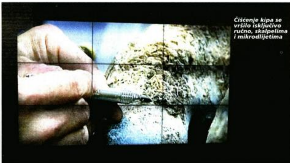
Čišćenje kipa se vršilo isključivo ručno, skalpelima i mikrodlijetima