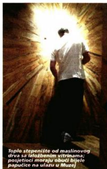
Toplo stepenište od maslinovog drva sa izložbenim vitrinama; posjetioći moraju obući bijele papuče na ulazu u Muzej