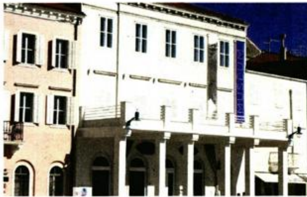
Muzej Apoksiomena u Malom Lošinj, smješten u nekadašnju palaču Kvarner. Bijela fasada krije moderan i otkačen Muzej

Apoksiomen se tako, nakon gotovo 20 godina lutanja, poput Odiseja vratio kući u Lošinj, tamo gdje je i pronađen daleke 1997. godine, a slučajno ga je pronašao belgijski turist René Wouters, zaljubljenik u podvodnu fotografiju