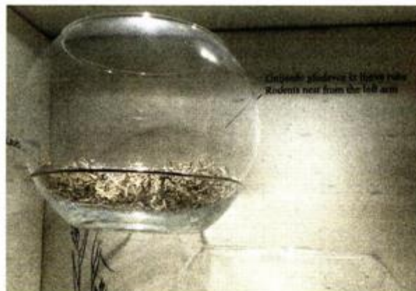
Gnijezda mišića koja su pronađena u skulpturi