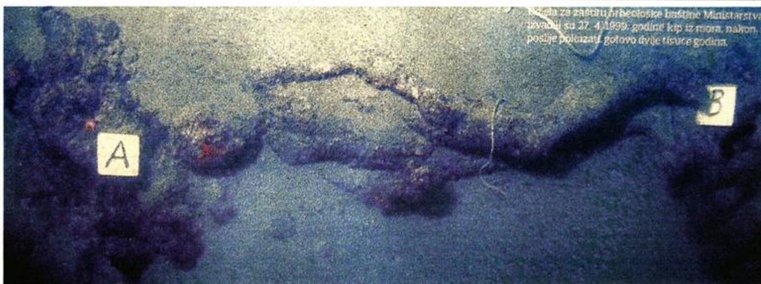
Kip za zaštitu, arheološke baštine Ministarstva izvađen su 27. 4. 1999. godine kip iz mora, nakon što poslije pokazati gotovo dvije tisuće godina.