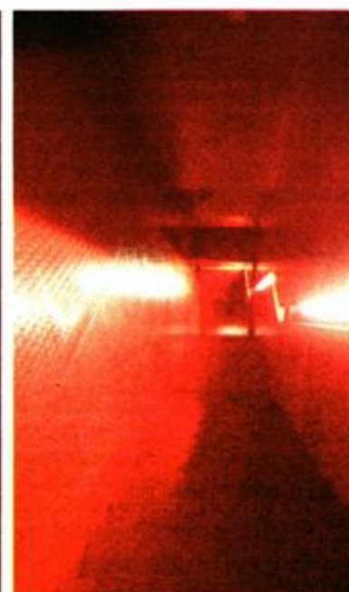
Crveno stepenište kao crvena nit vodilja do izložbenih soba

Restauracija brončane skulpture je bila dugotrajna i mukotrpana; u bazenu u Malom Lošinjju je vršeno odsoljavanje kipa slatkim vodom iz Vranskog jezera sa Cresa, a skidanje morskog obraštaja i sedimenta se vršilo u Hrvatskom restauratorskom zavodu u Zagrebu i to isključivo ručno uz pomoć skalpela, mikrodlijeta te finim rotacionim četkicama i kistovima. Taj su mukotrpan posao uglavnom obavili Antonio Šerbetić, majstor-restaurator iz HRZ-a i talijanski konzervator Guliano Tordi iz Firenze koji se bukvalno preselio u Zagreb; njih su dvojica radili na čišćenju i restauraciji statue punih šest godina.