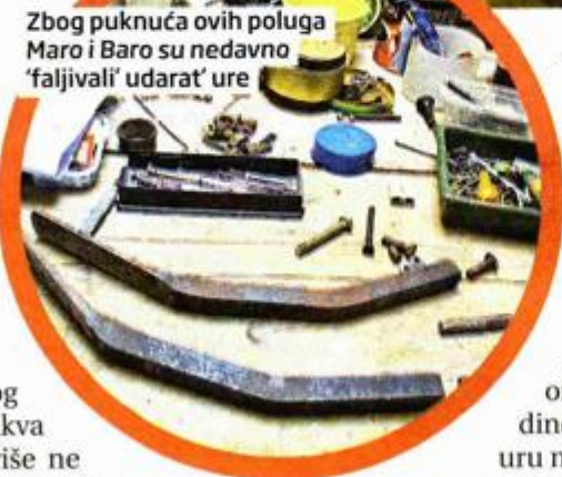
Zbog puknuća ovih poluga Maro i Baro su nedavno 'faljivali' udarat' ure