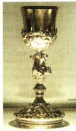
Kalež, venecijanska radionica, 18. st., iz župne crkve u Omišlju