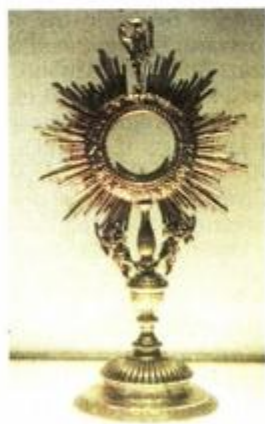
Pokaznice, venecijanska radionica, 18. st., iz župnih crkava u Dobrinju i Risiki

Joseph Ratzinger - Papa Benedikt XVI., Duh liturgije, Verbum, Split, 2015.