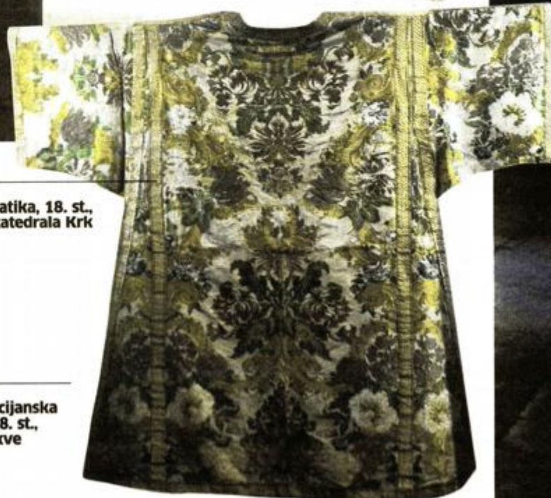
Dalmatika, 18. st., katedrala Krk