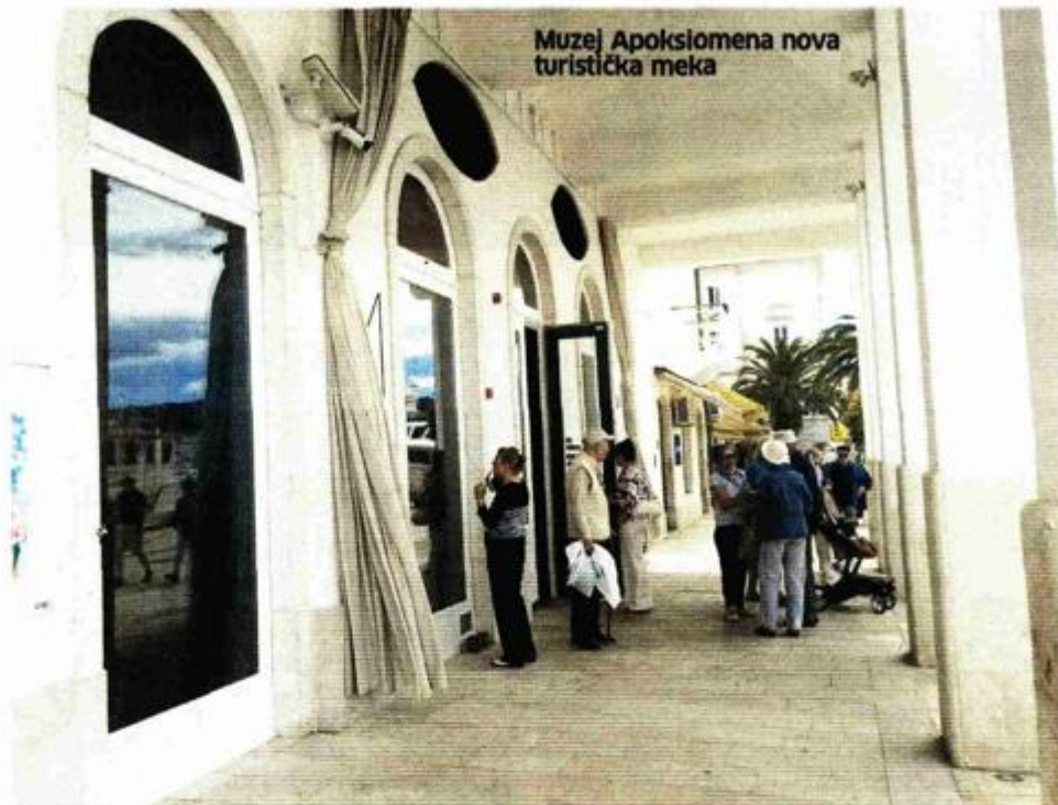
Muzej Apoksiomena nova turistička meka

– Ljudi imaju različita očekivanja prilikom ulaska. Iako su stanovnici na početku puno skeptičniji od ostalih, na kraju obilaska napuštaju zgradu s istaknutim ponosom i pozitivnim šokom. Sve češći su posjetitelji koji nam dolaze već pripremljeni, no bez obzira na pripremu, veliki broj njih bijelu sobu napušta sa suzama. Strani posjetitelji ipak su pripremljeniji. Najčešći gosti muzeja su Talijani koji nam prilaze s već velikim predznanjem i temeljima, željni interakcije. I lokalni iznajmljivači vrlo rado upućuju svoje goste i prijatelje. Posjetitelji ulaze s jednim izrazom lica, a izlaze s potpuno drugim. Prolazak kroz muzej je za njih svojev-