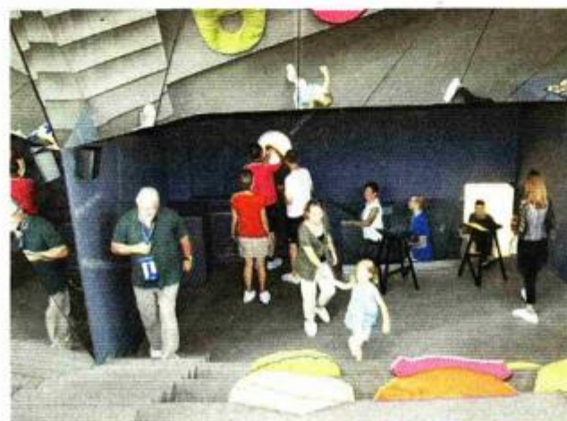
Iako ima samo jedan jedini eksponat, obilazak muzeja traje 45 minuta unutar kojih se uistinu može svašta vidjeti i naučiti

Priča o Muzeju također je objavljena na najpoznatijem svjetskom dizajnerskom web portalu Designboom koji broji 6 milijuna čitatelja mjesečno, a Architecture Digest upravo je lošinjski Muzej Apoksiomena uvrstio među sedam najzanimljivijih novih svjetskih muzeja. Također je objavljen i u velikom broju arhitektonsko dizajnerskih časopisa, a krasi i naslovnici korejskog magazina o interijeru Bob Magazine.