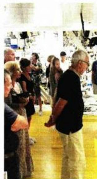
Svakoga dana kroz muzej prođe maksimalno 240 posjetitelja