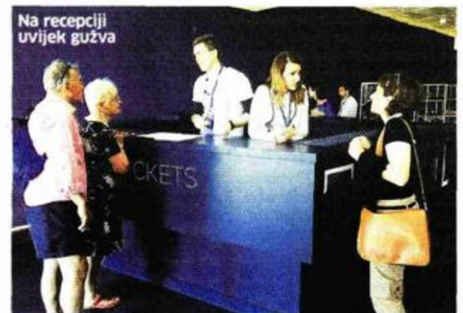
Na recepciji uvijek gužva

Izuzevši posjet predsjednice Kolinde Grabar Kitanović i državnog vrha RH prilikom otvorenja Muzeja 30. travnja, muzejem su prošle i druge poznate ličnosti poput skija-