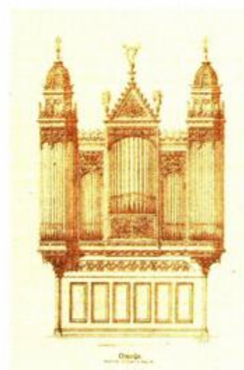
Bolleov nacrt za orgulje u Krapini