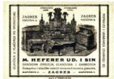
Reklama za orgulje Heferer