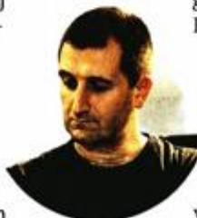
ALDUK Posljednjih godina učinjeno je mnogo toga u pogledu restauracije stečaka