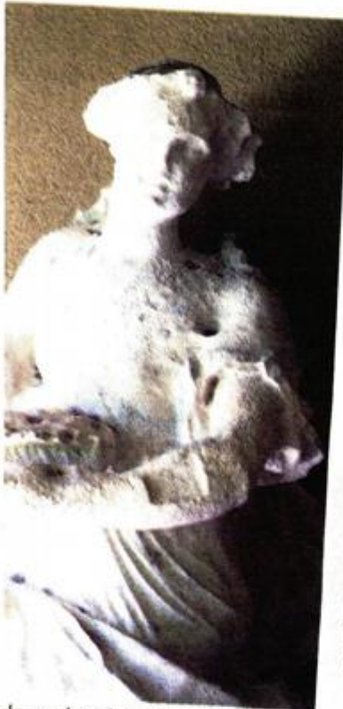
la predstavljaju jakost, zasluge, igu i slikarstvo

•• Palaču Bajamonti/Dešković je 1858. godine dao sagraditi dr. Antonio Bajamonti, kasniji dugogodišnji gradonačelnik, nakon što je na dražbi kupio zemljište na Šperunu, otvoreni prostor koji je nastao nakon uklanjanja najzapadnijeg bastiona mletačkog obrambenog sustava. Ona je dio urbanističke cjeline koju čine Prokurative, crkva i samostan sv. Frane i Riva, stvarajući tako dojmljivu vizuru obale koja je, prema Bajamontijevoj zamisli, trebala odisati duhom Venecije.