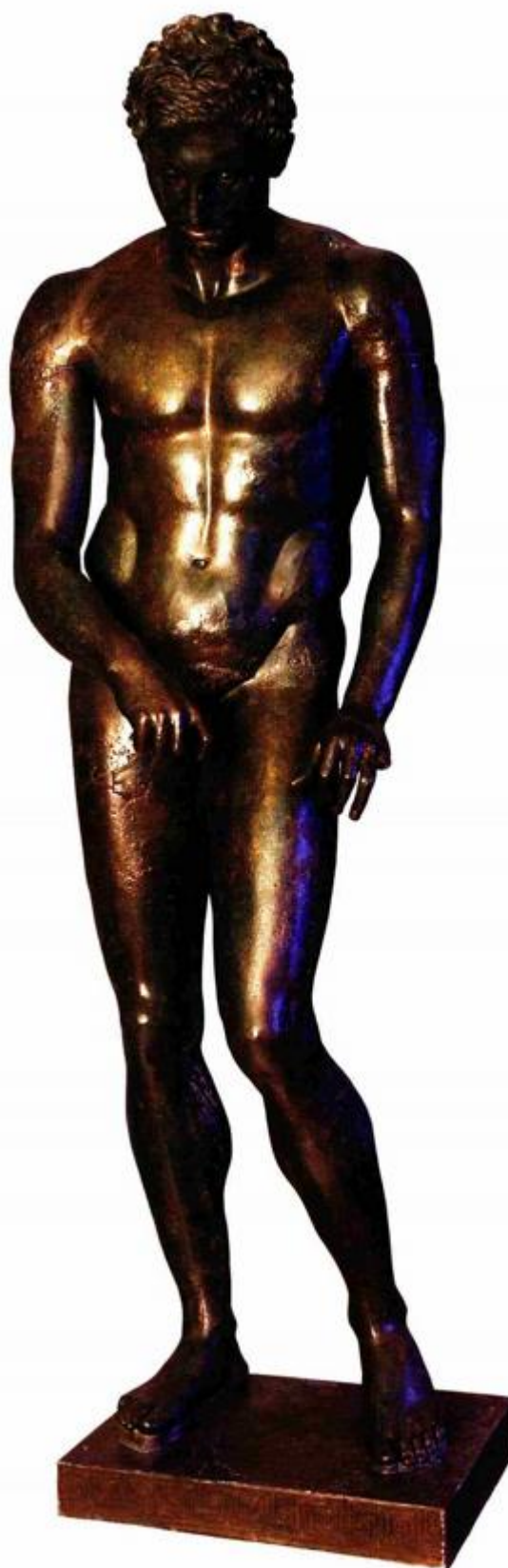
CITY BREAK 13 / MAY 2013