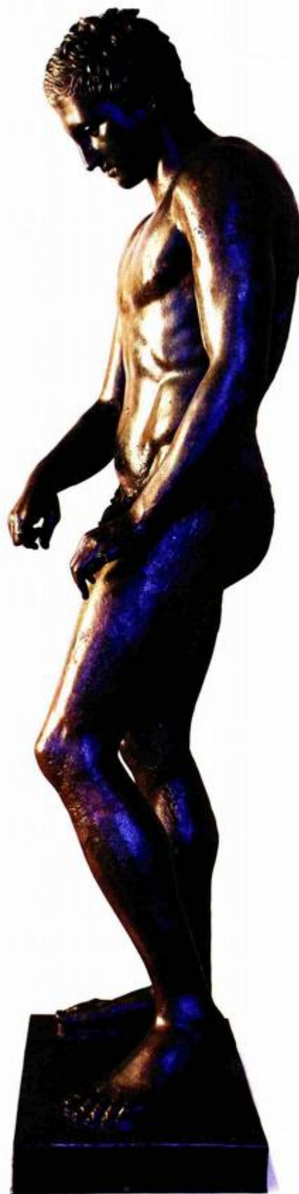
CITY BREAK 13 / MAY 201