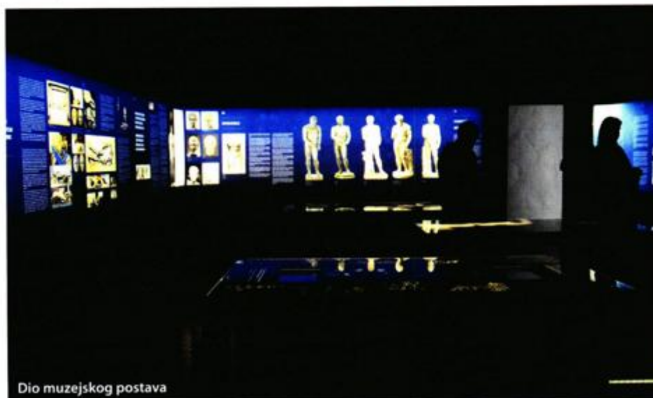
Dio muzejskog postava

Na svečanosti su bili i ministri turizma Anton Kliman te pomorstva Oleg Butković i mnogi drugi uzvanici. Za kraj svečanosti na moru je upriličen trodimenzionalni hologramski prikaz Apoksiomena. ■