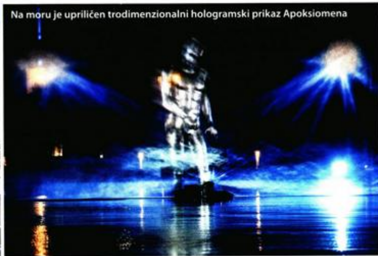
Na moru je upriličen trodimenzionalni hologramski prikaz Apoksiomena

Restauratorskome zavodu vrijednu nagradu na europskoj razini za zaštitu kulturne baštine. "Apoksiomen je ne samo veliko dostignuće antičke plastike, nego i umjetnina koja svjedoči zalaganju Ministarstva kulture i Hrvatskoga restauratorskog zavoda na zaštiti baštine", rekao je. Poimenično je zahvalio mnogim