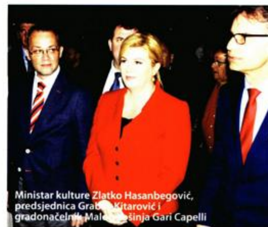
Ministar kulture Zlatko Hasanbegović, predsjednica Grabar-Kitarović i gradonačelnik Maloga Lošinja Gari Capelli

Među zaslužnima za realizaciju tog projekta izdvojila je bivšega ministra kulture Božu Biškupića, nazočnog na svečanosti, istaknuvši da je podržao napore gradonačelnika Maloga Lošinja Garija Cappellija i mnogih drugih koji su se zalagali za povratak Apoksiomena na Lošinj. Hrvatski turizam mora se preoblikovati u smjeru kulturnoga turizma jer se, primjerice Mali Lošinj, ne može oslanjati samo na ne-