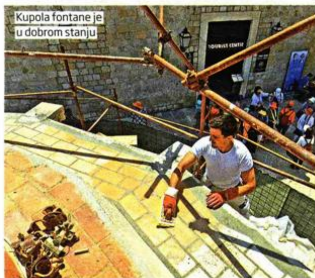
Kupola fontane je u dobrom stanju