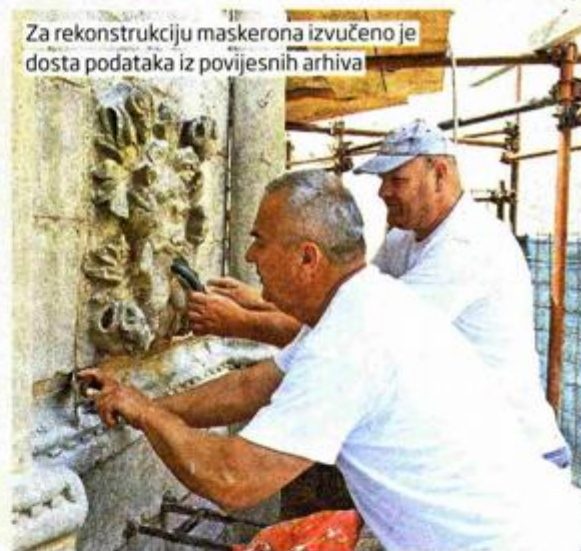
Za rekonstrukciju maskerona izvučeno je dosta podataka iz povijesnih arhiva

u Zavodu. Laserska su se čišćenja koristila samo na nekim zonama od visoke restauratorske i likovne