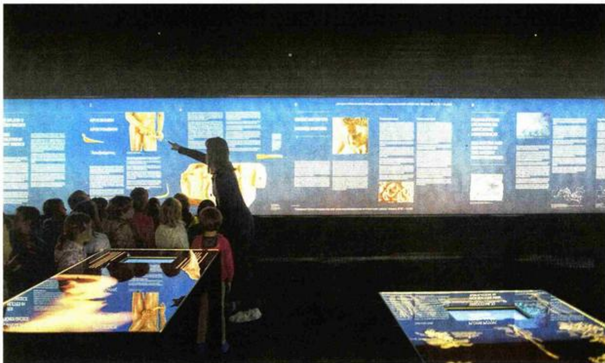
Crna, znanstvena soba izaziva poseban interes posjetitelja