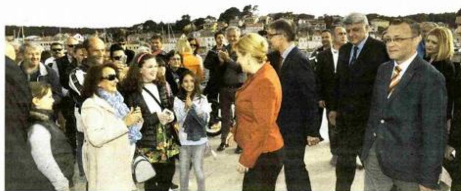
Topao lošinjki doček političkog svijeta

– Kao što je znamenita Venera Miloska ili Nika sa Samotrake dio identiteta velikih svjetskih metropola i njihovih muzeja, to će sada biti Apoksiomen za Lošinj i Hrvatsku. I u Hrvatskoj već postoje brojni primjeri kul-