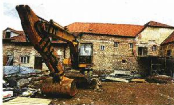
Radovi na uređenju novog-starog muzeja na adresi Kaptol 28

moći pogledati na izložbi koja se otvara danas, prvi put su u javnosti.