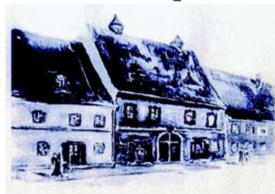
Pogled na pročelje stare obiteljske kuće Brlić (u sredini) izgrađene 1799. godine (akvarel Milice Brlić)