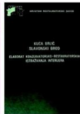
Naslovnica Elaborata HRZ-a iz 2015.