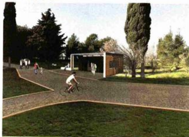
Projekcija šetališta i zone rekreacije