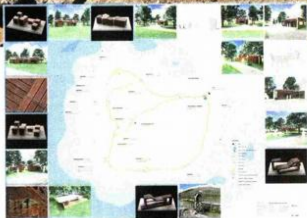
Mapa budućeg arheološkog parka

opremljen biljem koje su kultivirali stari Rimljani. Postavit će se 13 klupa, među kojima tri solarne e-klupe, koševi za otpatke, stalci za bicikle i solarne e-stablo. Unutar rimskog kamenoloma predviđeno je postavljanje montažne pozornice za potrebe manjih glazbenih događanja, kao i prenosive montažne platforme za scenska događanja, nabrava Floričić.