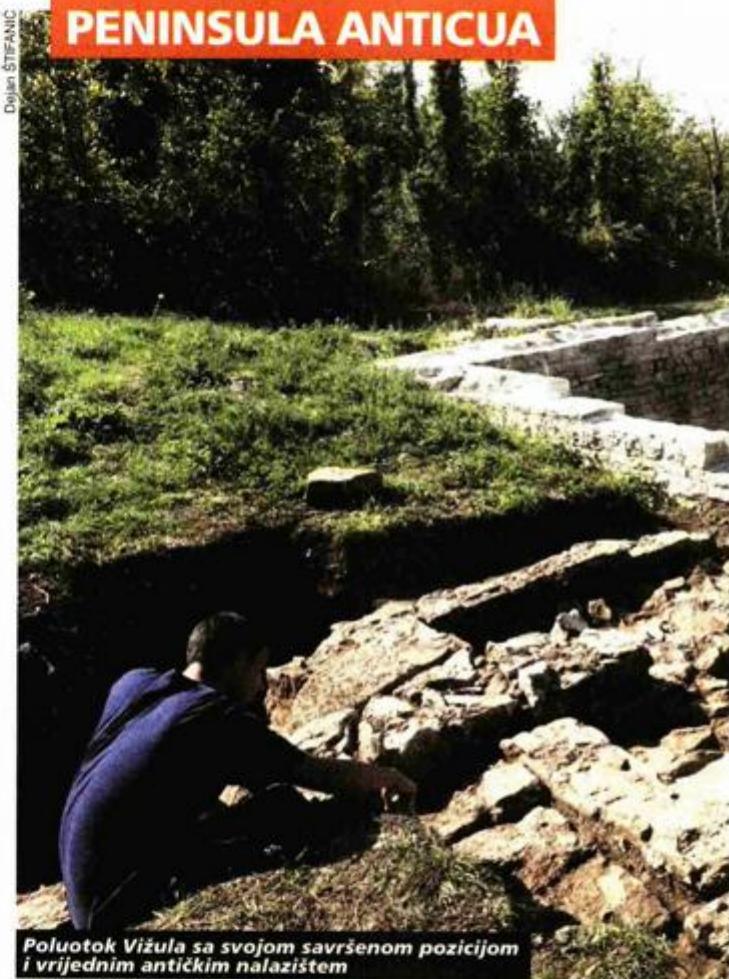
Poluotok Vižula sa svojom savršenom pozicijom i vrijednim antičkim nalazištem