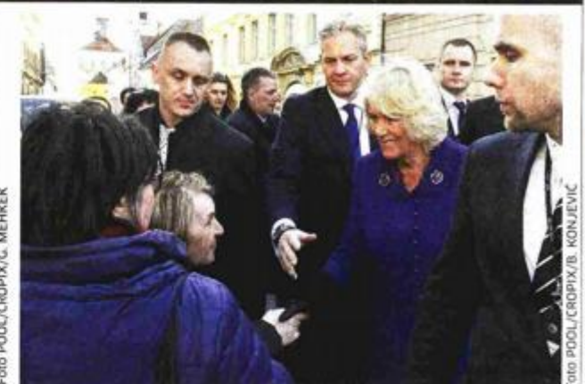
Vojvotkinja Camilla srdačna s građanima Zagreba