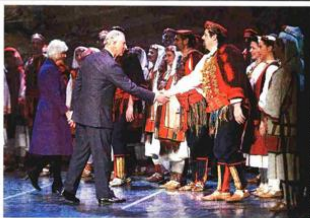
U HNK-u par je nazočio programu obilježavanja 400. godišnjice smrti Williama Shakespearea