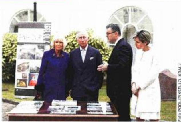
U Banskim dvorima britanskom paru domaćin je bio premijer Tihomir Orešković sa suprugom Sanjom