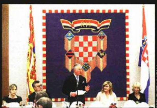
Za desert se poslužene maline na rižinom čipsu

Prema informacijama iz Ureda predsjednice, na meniju svečane večere bio