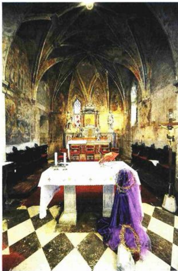
Svetište i gotički zvjezdasto-rebrasti svod

Poslije otkrića fresaka 1950-tih godina svetište crkve sv. Jurja doživjelo je veće restauratorske radove izvedene u okviru tadašnjih tehnoloških mogućnosti, ali nakon više od pola stoljeća stanje očuvanosti nije bilo primjereno njihovoj kvaliteti i značaju. Stoga se 2009.