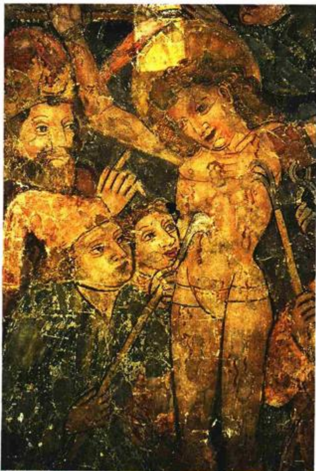
Mučeništvo svetog Jurja – jedna od scena torture

Kao vrlo rijedak izdvaja se prikaz Euharistijskog Krista kojem kroz jedno rame prolazi vitica vinove loze, a kroz drugo klasje žita. U cijeloj Europi samo je 15-ak takvih prikaza, a jedan se nalazi i u kapeli sv. Antona u Jurčićima kod Kastva. No, još veću rijetkost predstavlja Euharistijsko čudo – slika na kojoj vidimo biskupa koji drži pokaznicu s hostijama, dok druge lete uokolo, a puk ih pokušava uhvatiti. Što zapravo predstavlja ova scena nije poznato. Literarni izvor