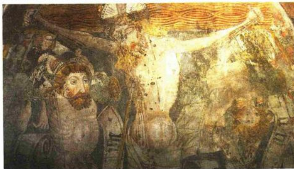
Raspeti Krist između dva razbojnika izvitoperena na svojim križevima

cizno izrađenoj dokumentaciji, uz primjenu 3D tehnologije, na različitim laboratorijskim ispitivanjima te na istraživačkom radu »in situ«. Nakon obavljenog mehaničkog čišćenja uslijedit će kemijsko, a konačan završetak radova očekuje se u sljedeće tri godine.