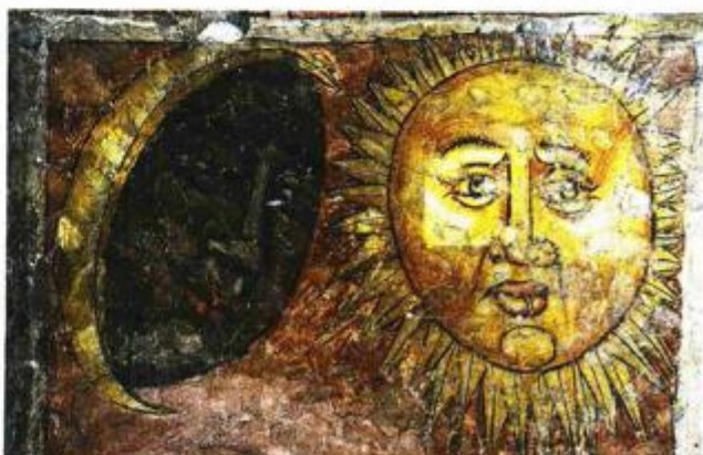
Osiike Mjeseca i Sunca