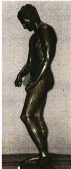
Lošinjski kip najbolje je sačuvan od 8 varijacija

Kip predstavlja atleta, mladog sportaša u trenutku dok čisti strigil (strugaljka) kojim je sa svoga tijela sastrugao ulje, prašinu i znoj nakon natjecanja. Tijekom restauracije, istraživanjem materijala i stila izrade kip je datiran u 2.-1. st. prije Krista, a prototip na temelju kojega je izrađen, znatno je stariji, iz sredine 4. st. pr. Kr. Imajući to na umu, očekuje se da će Muzej Apoksiomena, kao jedan od najprepoznatljivijih simbola Lošinja što uskoro otvara svoja vrata posjetiteljima, privući veliki broj znatiželjnika. Naime, nakon tehničkog pregleda prostora budućeg muzeja izvršenog još u srpnju prošle godine, krajem 2015. godine izvođač radova predao je Gradu zgradu bivše palače Kvarner smještene u samom centru Malog Lošinja. Cjelokupnu investiciju izgradnje nekadašnje palače Kvarner te svih neophodnih uvjeta i kriterija Hrvatskog restauratorskog zavoda, kao i uvjete održavanja statue i stalnog postava financirali su Grad Mali Lošinj i Ministarstvo kulture RH kao suosnivači muzeja, a riječ je o 21,8 milijuna kuna.