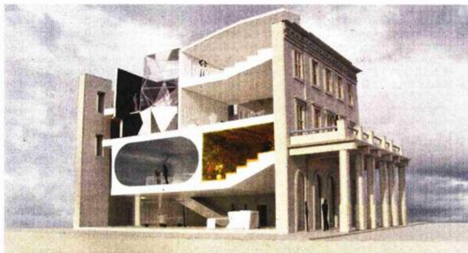
Očekuje se da će suvremeni postav, ali i sam Apoksiomen, privući veliki broj ljudi na Lošinj

lokupni projekt izgradnje Muzeja Apoksiomena.