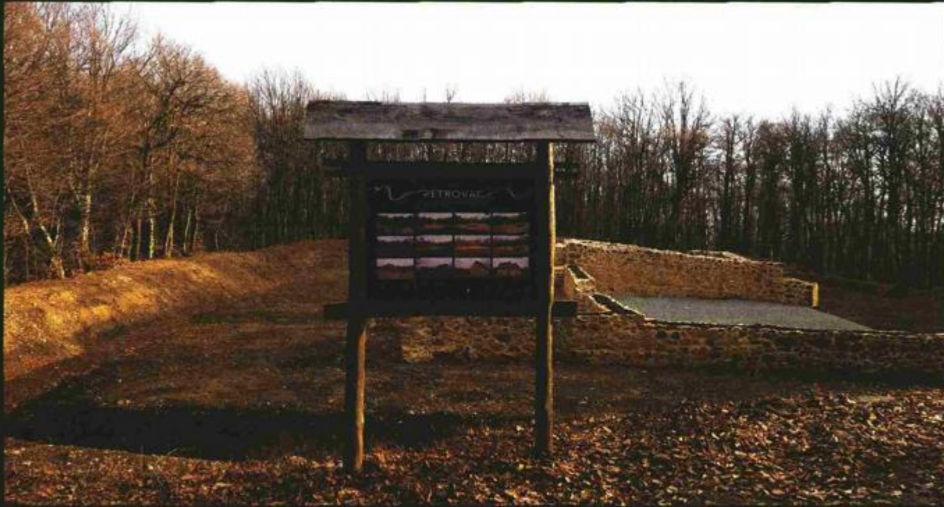
Hrvatski restauratorski zavod je završio restauraciju ostataka pavlinskog samostana Sv. Petra na Malom Petrovcu, najvišem vrhu Petrove gore

Šumarije Krašić izmijenili su poučne ploče uz samostan tako da su sad svim posjetiteljima Turističkog centra Petrova gora, kojim upravlja LD Muljava, dostupne najnovije informacije vezane uz samostan. Svečano otvorenje restauriranog samostana očekuje se početkom 2016. godine.