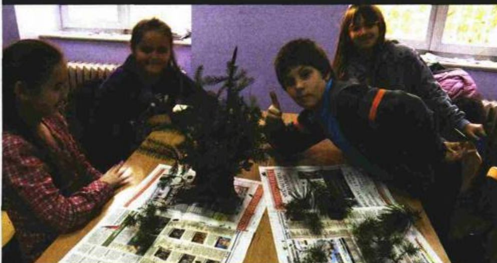
Radionice pod nazivom "Koje je moje božićno drvo?", UŠP Buzet upoznala je 228 učenika na koji način odabrati stabalce za dom

Hrvatski restauratorski zavod je za-vršio restauraciju ostataka pavlinskog samostana sv. Petra na Malom Petrov-cu, najvišem vrhu Petrove gore. Radnici