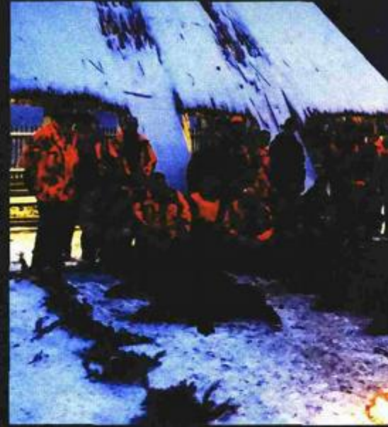
Tijekom studenog, prosinca i siječnja provedeni su skupni lovovi na divlje svinje unutar lovnog revira Porič

Iz rasadnika na području UŠP Osijek tijekom prosinca uspješno je završena isporuka planirane količine sadnica za potrebe jesenske sadnje. U rasadniku Višnjevac postavljena je proizvodnja sad-