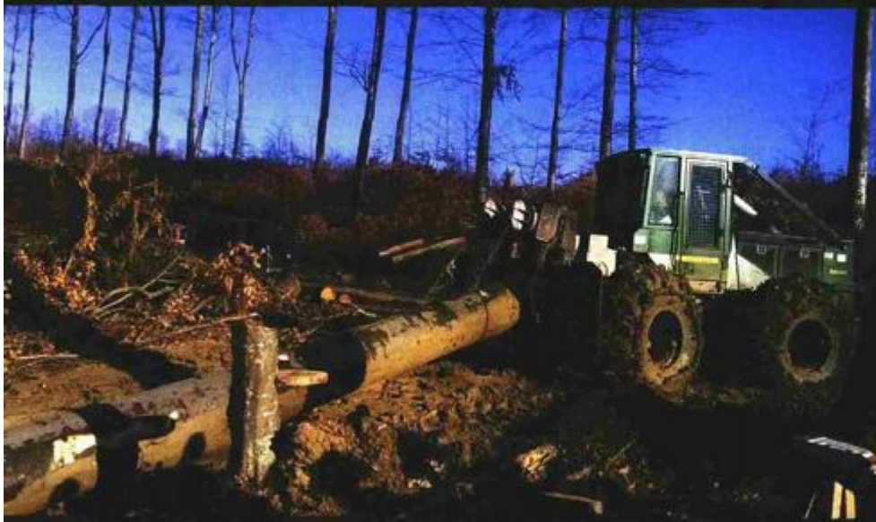
Tijekom sječa u prosincu 2015. godine

Proizvodnja tucanika i ostalih frakcija u prosincu 2015. godine ostvarena je s