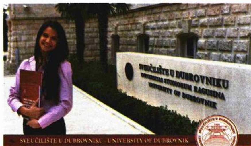
SVEUČILIŠTE U DUBROVNIKU - UNIVERSITY OF DUBROVNIK