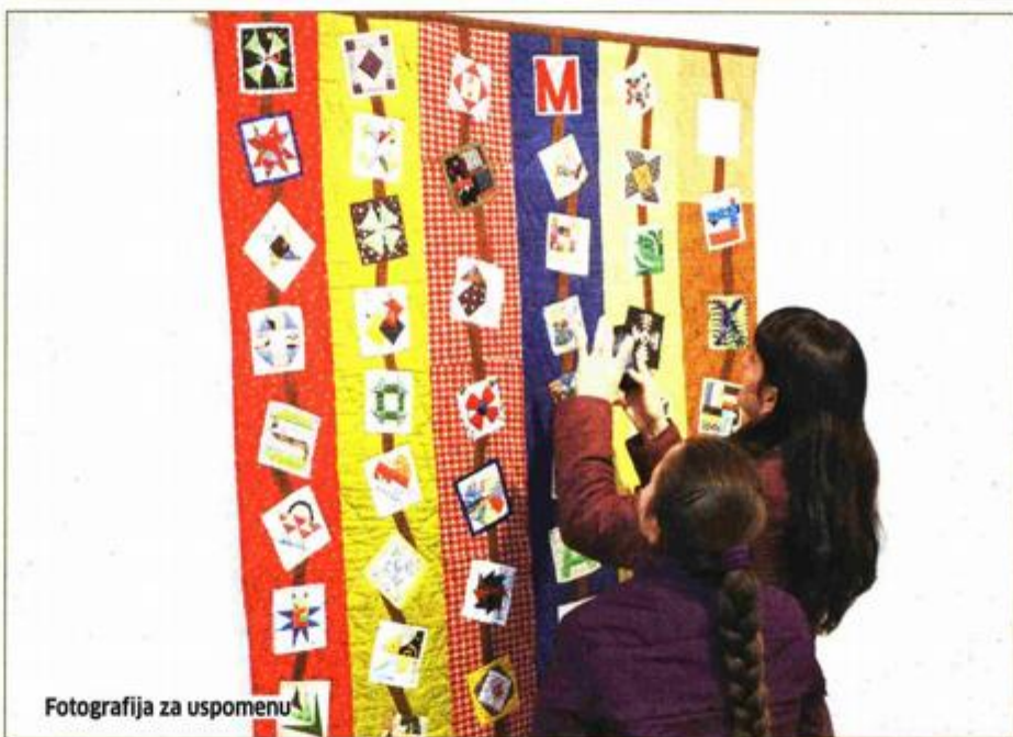
Fotografija za uspomenu