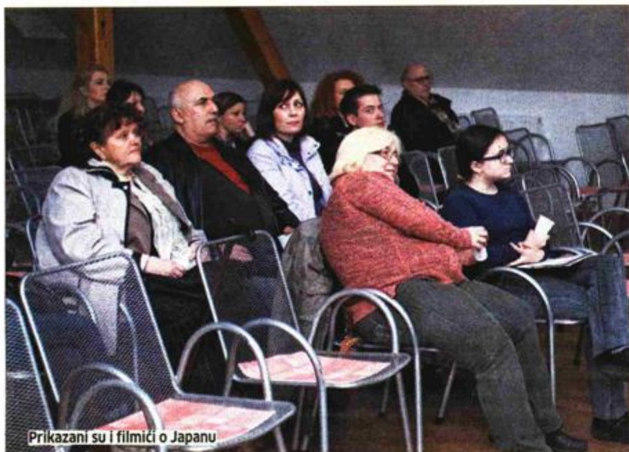
Prikazani su i filmići o Japanu