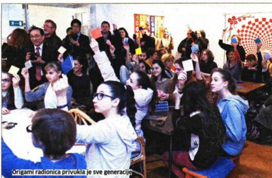
Origami radionica privukla je sve generacije