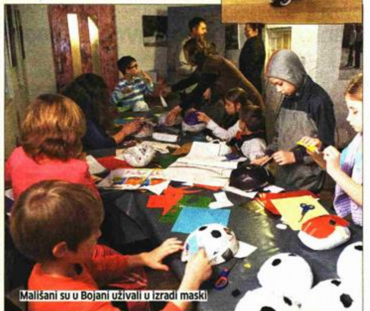
Mališani su u Bojani uživali u izradi maski