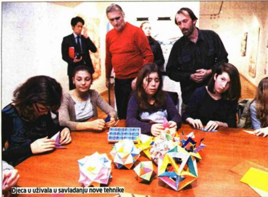
Djeca u uživalu u savladanju nove tehnike