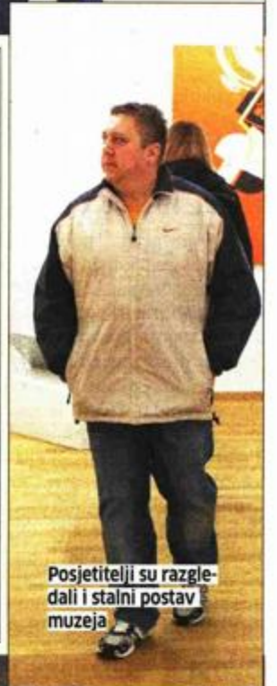
Posjetitelji su razgledali i stalni postav muzeja