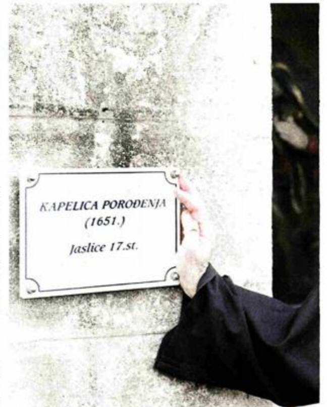
Kapela Porodenja u samostanskim se zapisima prvi put spominje

Gvardijan Sršen podsjeća da su košljunske jasllice bile na izložbi europskih jasllica u Veroni 1988./1989. godine i da su tamo od stručnjaka ocijenjene kao jedne od najljepših i najstarijih u Europi. Također podsjeća da je Italija tada izdala prigodnu božićnu poštansku marku s motivom košljunskih jasllica, a isto je naša zemlja učinila 1992. godine. K tome, upućuje da je ove jasllice prvi fotografirao i prvi 1932./33. godine na njihovu umjetničku vrijednost ukazao povjesničar umjetnosti Artur Schneider.