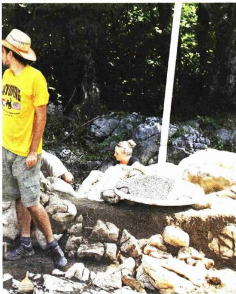
U Viničici kod Josipdola nalazište je staro gotovo 30.000 godina i ovog ljeta nadeni su ostaci naroda Japoda. No, ima tragova rimske kulture, utvrdenog grada s bedemima

lazišta. Neke sredine, poput Dalmacije, oduvijek su puno pažnje posvećivale istraživanju, no ovaj je središnji dio Hrvatske bio, zapravo, neistražen. Upitna je bila i kvaliteta arheoloških istraživanja. Primjerice, tada se malo istraživalo bogatu ostavštinu iz rimskog perioda. Da je riječ o kvalitetnim i jedinstvenim nalazištima, govore lokacije koje se istražuju poput, rimskih utvrda u Bukovlju, pa eto i čamca na Kupi kod Karlovca kojim su Rimljani prevozili cigle za gradnju – kaže nam Krešimir Raguž, jedini arheolog zaposlen u karlovačkom Konzervatorskom odjelu Ministarstva kulture. Kaže da je puno toga utjecalo na ovu veliku promjenu, ponajprije činjenica što Hrvatska želi istraživati svoju povijest.