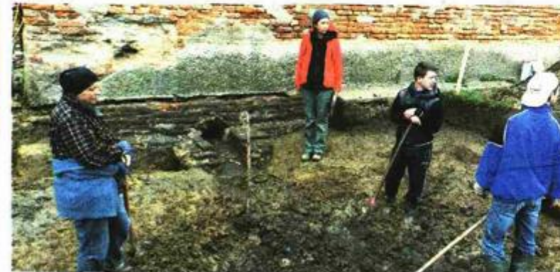
Ljelje ispred bivše osmanske kule