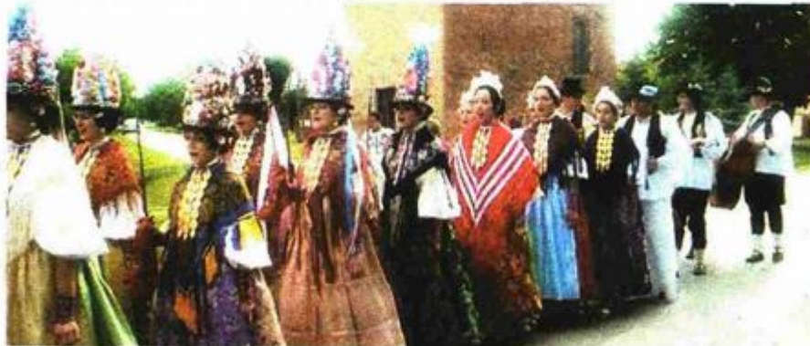
Ljelje ispred bivše osmanske kule