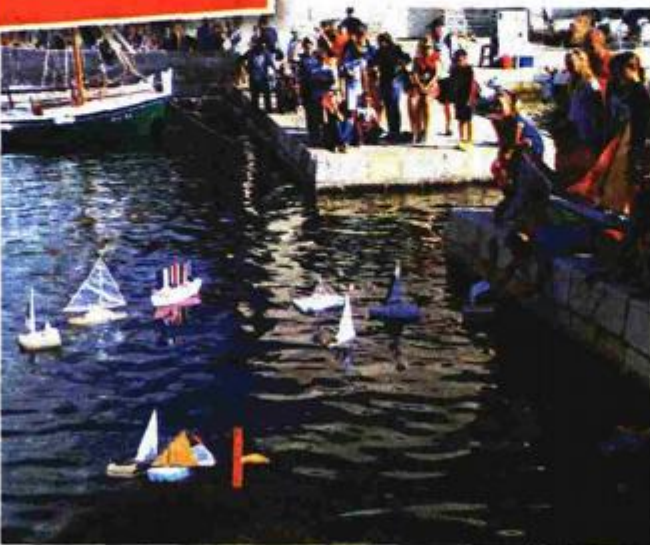
Porinuće brodova 'brodogradilišta' Osnovne škole Hvar na 5. fešti Forske pulene

Ovim susretima želimo odati počast našim precima koji su, zahvaljujući drvenom brodu, umijeću i iznimnim trudima, ostvarili ono čime se danas trebamo ponositi i što nas čini prepoznatljivima – kaže Tonči Buzolić Lojko